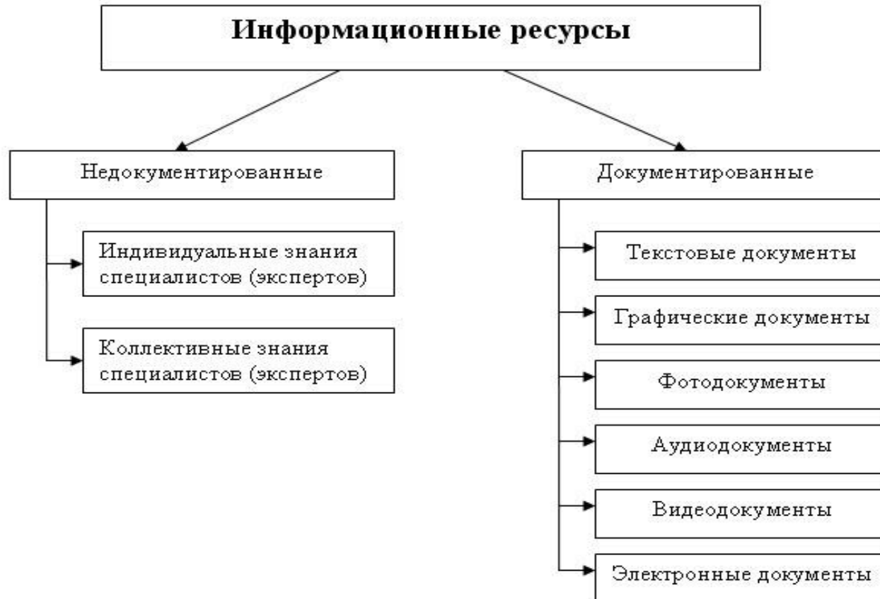
Рис.2.3. Классификация информационных ресурсов