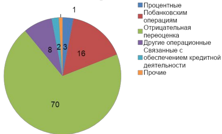
Рис.2. Долевое соотношение расходов ПАО «Промсвязьбанк» в 2014 году