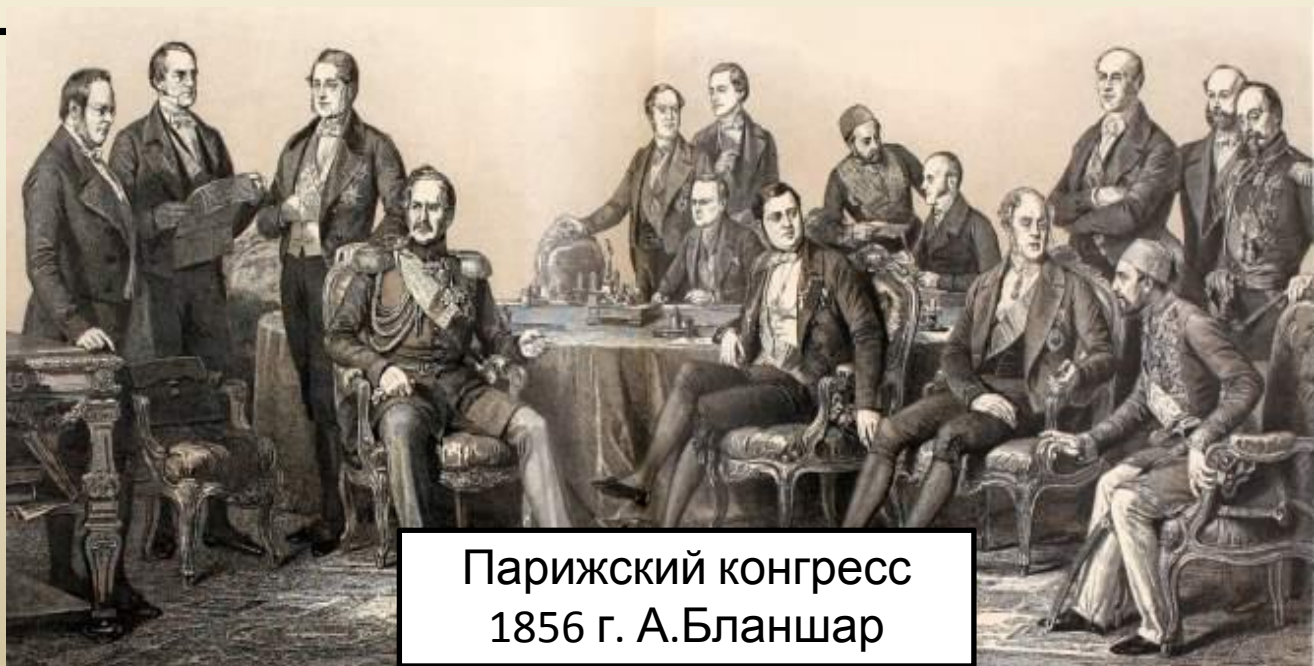
Парижский конгресс 1856 г. А.Бланшар

Престиж России на международной арене был подорван