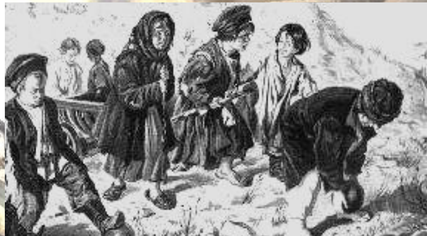
Защитники Севастополя Дети, собирающие ядра, хирург Н. Пирогов, матрос П.Кошка

На защиту города встали все жители. Дети приносили солдатам воду и продовольствие, а в промежутках между боями собирали неразорвавшиеся ядра.