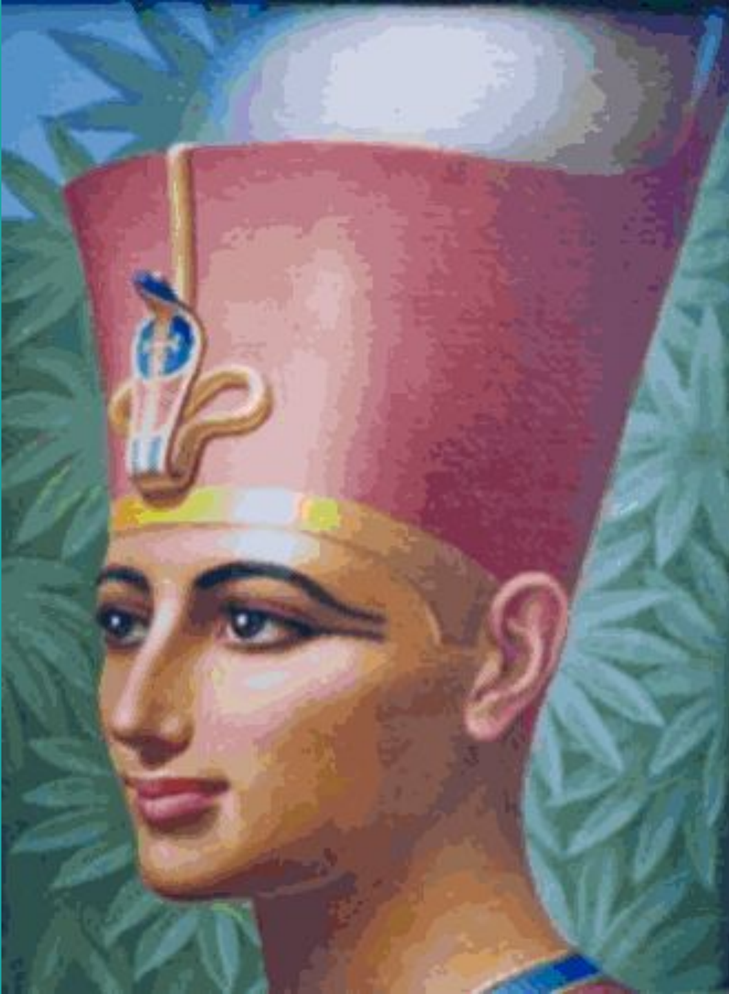
Египетский фараон Аменхотеп II из 18-й династии