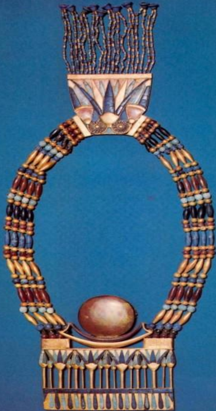
Ожерелье с пекторалью- символом новолуния