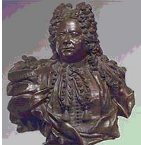
Бартоломео Карло Растрелли.

РАСТРЕЛЛИ (Rastrelli) Варфоломей Варфоломеевич (Бартоломео Франческо) (1700, Париж — 1771, Петербург ), граф, русский архитектор, итальянец по происхождению, сын Б. К. Растрелли. Один из величайших российских архитекторов 18 века наряду с Кваренги и Росси. Грандиозный пространственный размах, четкость объемов, строгую организованность планов сочетал с пластичностью масс, богатством скульптурного убранства и цвета, прихотливой орнаментикой.