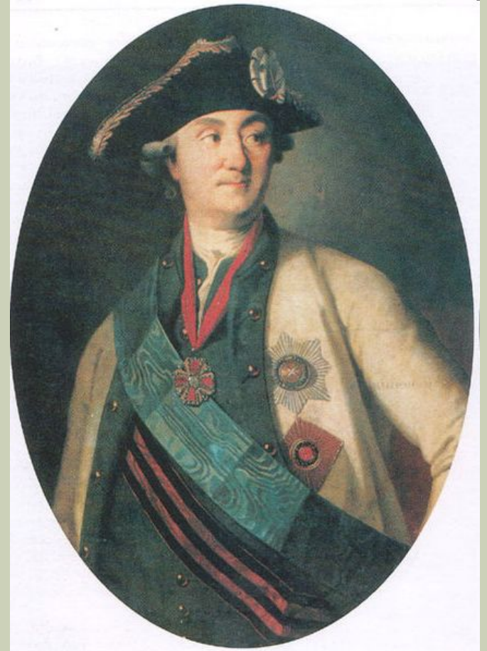
Портрет графа Орлова-Чесменского работы К.Л.Христинека.

Русский военный и государственный деятель, генерал-аншеф (1769), граф (1762), сподвижник Екатерины II. Брат её фаворита Григория Григорьевича Орлова.