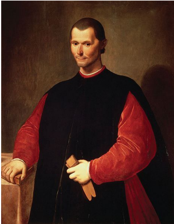
Николо Макиавелли (1469 -1527)

«Политика - совокупность средств, которые необходимы для того, чтобы прийти к власти и полезно использовать ее...»