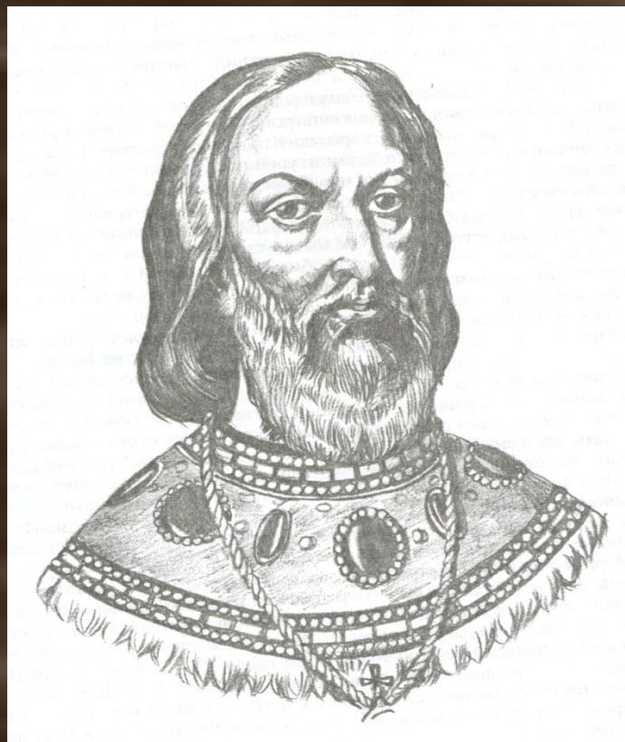
Отец царя – патриарх Филарет.