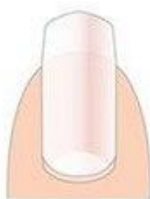
ОВАЛЬНАЯ С "УГОЛКАМИ"