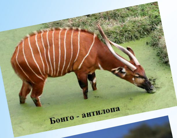
Бонго - антилопа