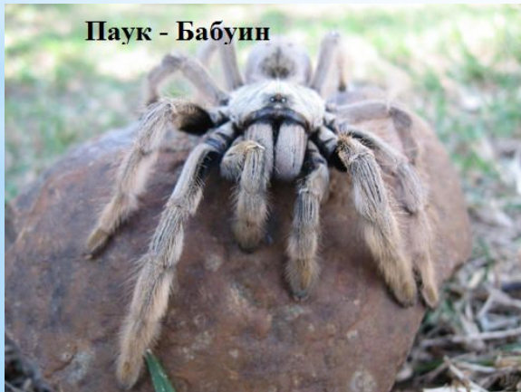
Паук - Бабуин