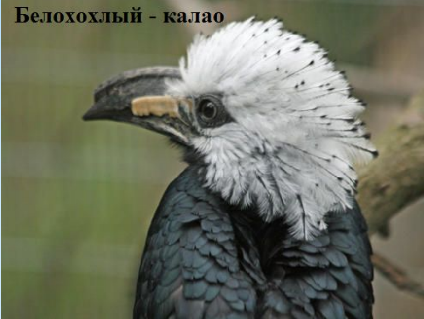
Белохохлый - калао