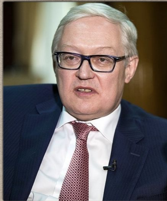
Рябков Сергей Алексеевич (отношение со странами Америки, вопросы безопасности и разоружения) с 12.06.2011