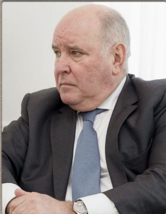
Карасин Григорий Борисович Статс-секретарь (отношение со странами СНГ и другими гос. органами) с 19.10.2005