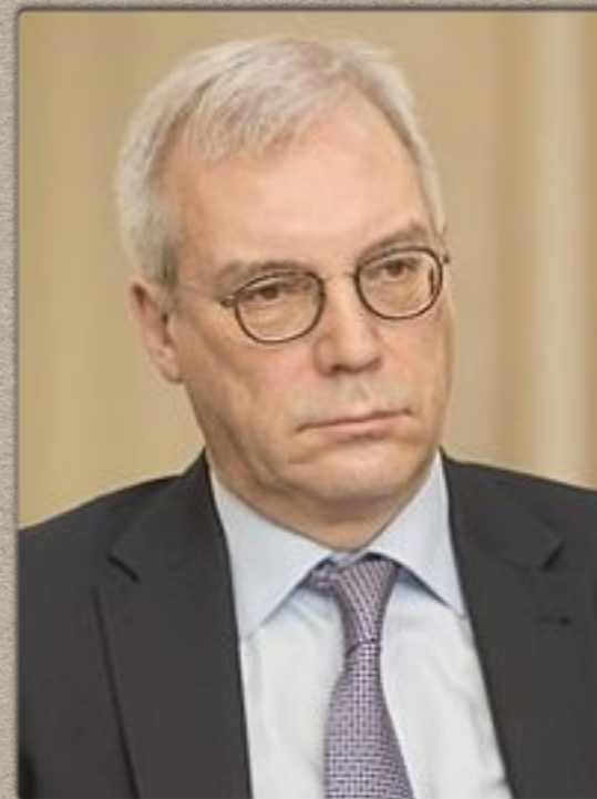
Александр Викторович Грушко С 22.01.2018