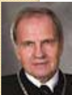
ЗОРЬКИН Валерий Дмитриевич Председатель Конституционного Суда РФ