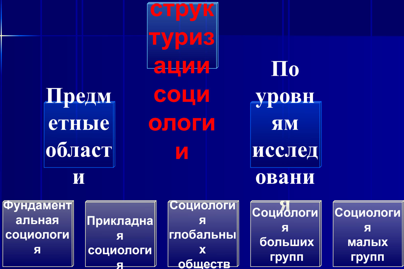
Схема 1. Структура социологии