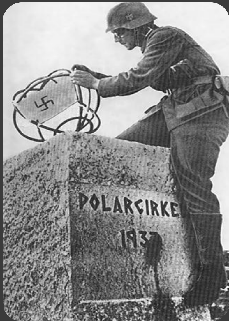
Немецкие войска в Норвегии