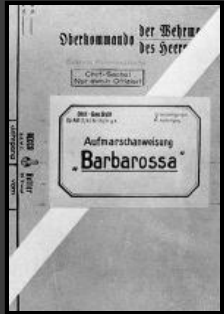
Папка с планом «Барбаросса».