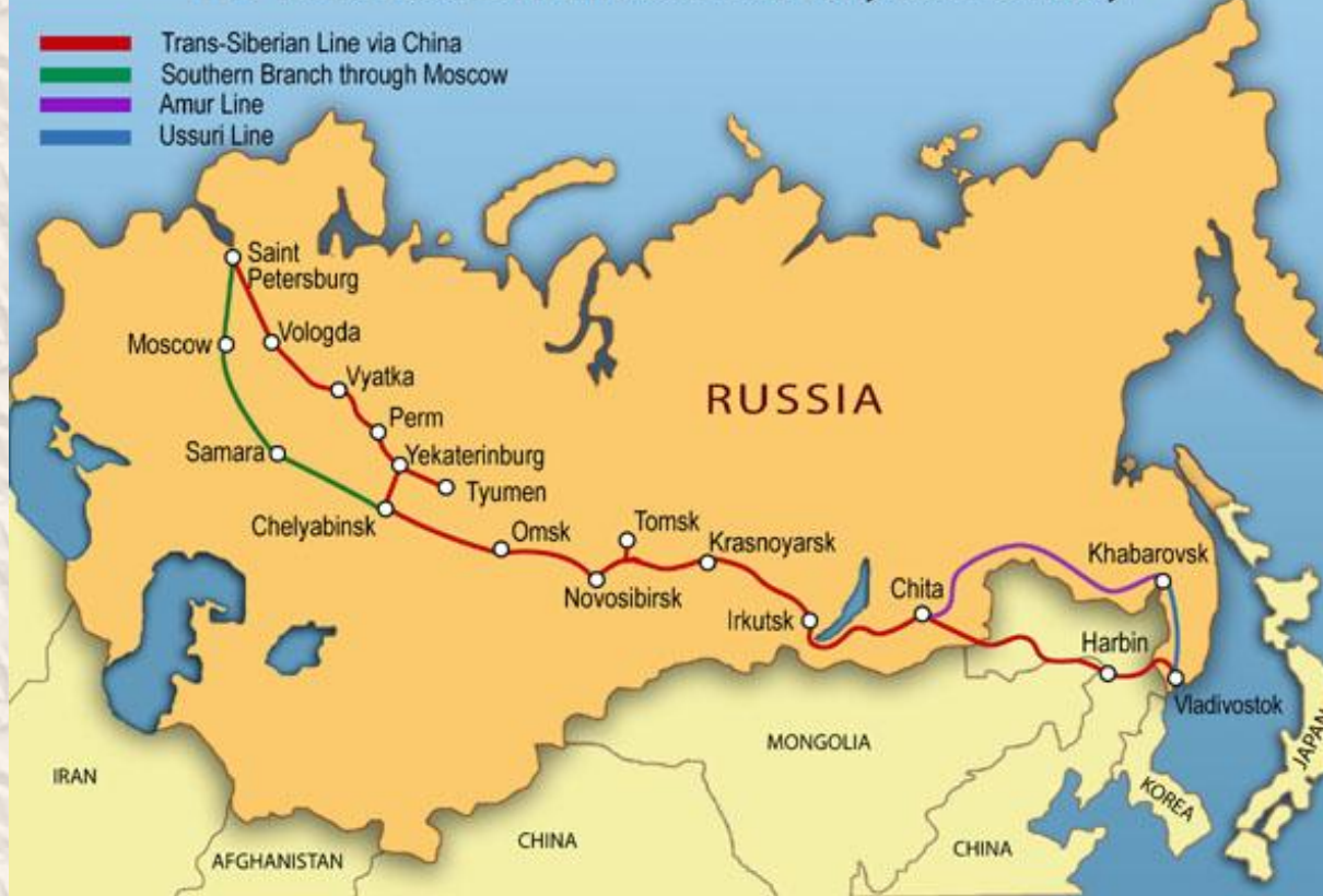
The Trans-Siberian Railroad in the Early 20th Century

В 1896 провёл успешные переговоры с Китаем - согласие Китая на сооружение в Маньчжурии Китайско-Восточной железной дороги (КВЖД)