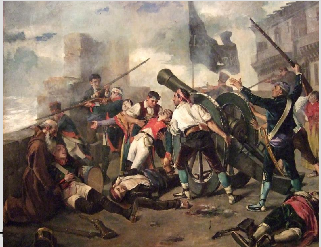
Восстание 2 мая 1808 г. в Мадриде Мануэль КАСТЕЛЛАНО