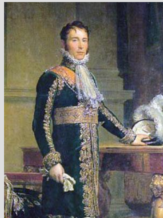
Богарне Евгений Наполеон - французский генерал, вице-король Италии (1805-14), пасынок Наполеона Бонапарта