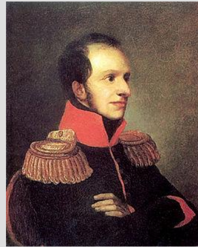
принц Георгий Ольденбургски й

1810 г. – таможенная война между Россией и Францией 1811 г. Франция присоединила владения герцога Ольденбургского