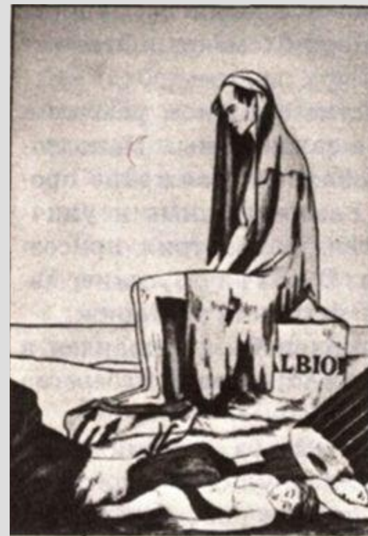
Англия после континентальной блокады. Сатирический рисунок.