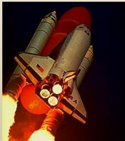
Космический корабль «Шатлл»