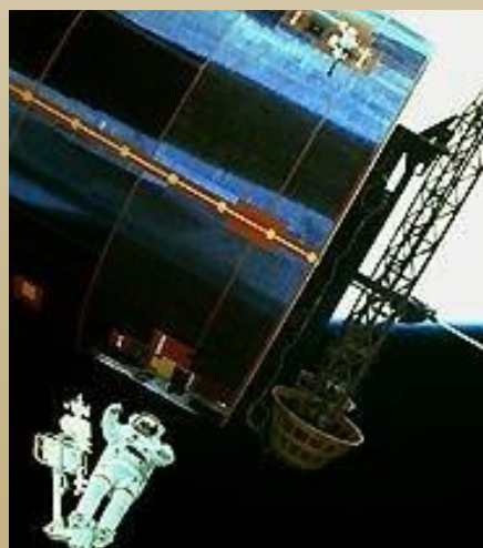
Космический аппарат «Синком IV-3»