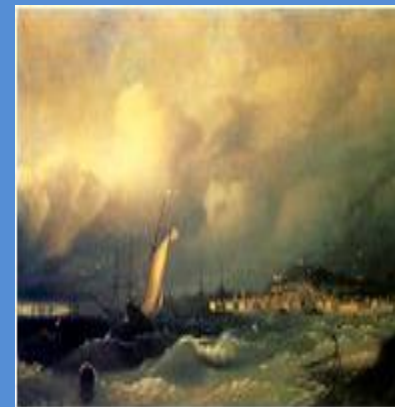
Вид Феодосии 1845 г