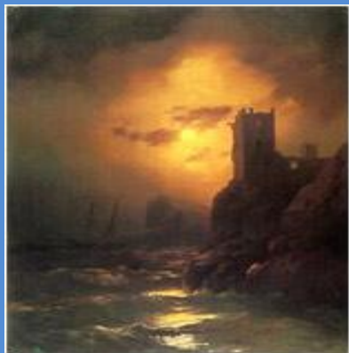
Башня. Кораблекрушение 1847 г

Итак, Иван Константинович Айвазовский - великий русский художник-маринист, который написал около 6000 картин на морскую тему. Такие как: