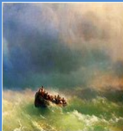
В бурю 1872 г