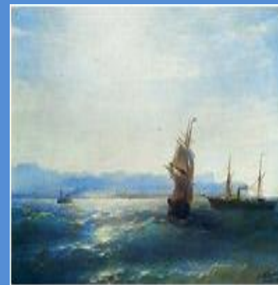
Солнечный день 1884 г