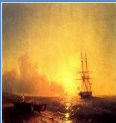
Рыбаки на берегу моря 1852 г