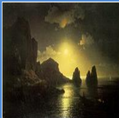
Морской вид 1841 г