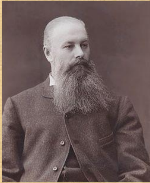
Докучаєв В. В.