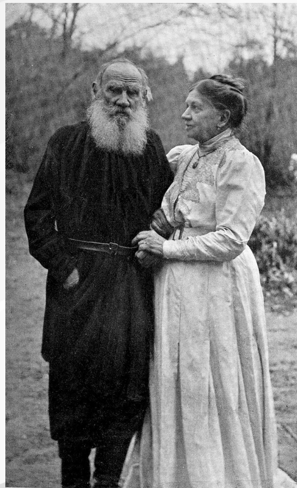
Софья и Лев Николаевич Толстые.

«Я дожил до 34 лет и не знал, что можно так любить и быть так счастливым».