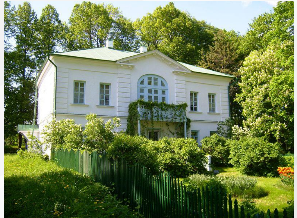
Музей-усадьба Л. Н. Толстого «Ясная Поляна»