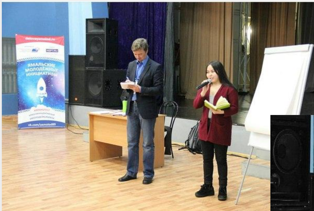
Представление проекта на «Ямальских молодежных инициативах». Окружная площадка на базе СЦМ.