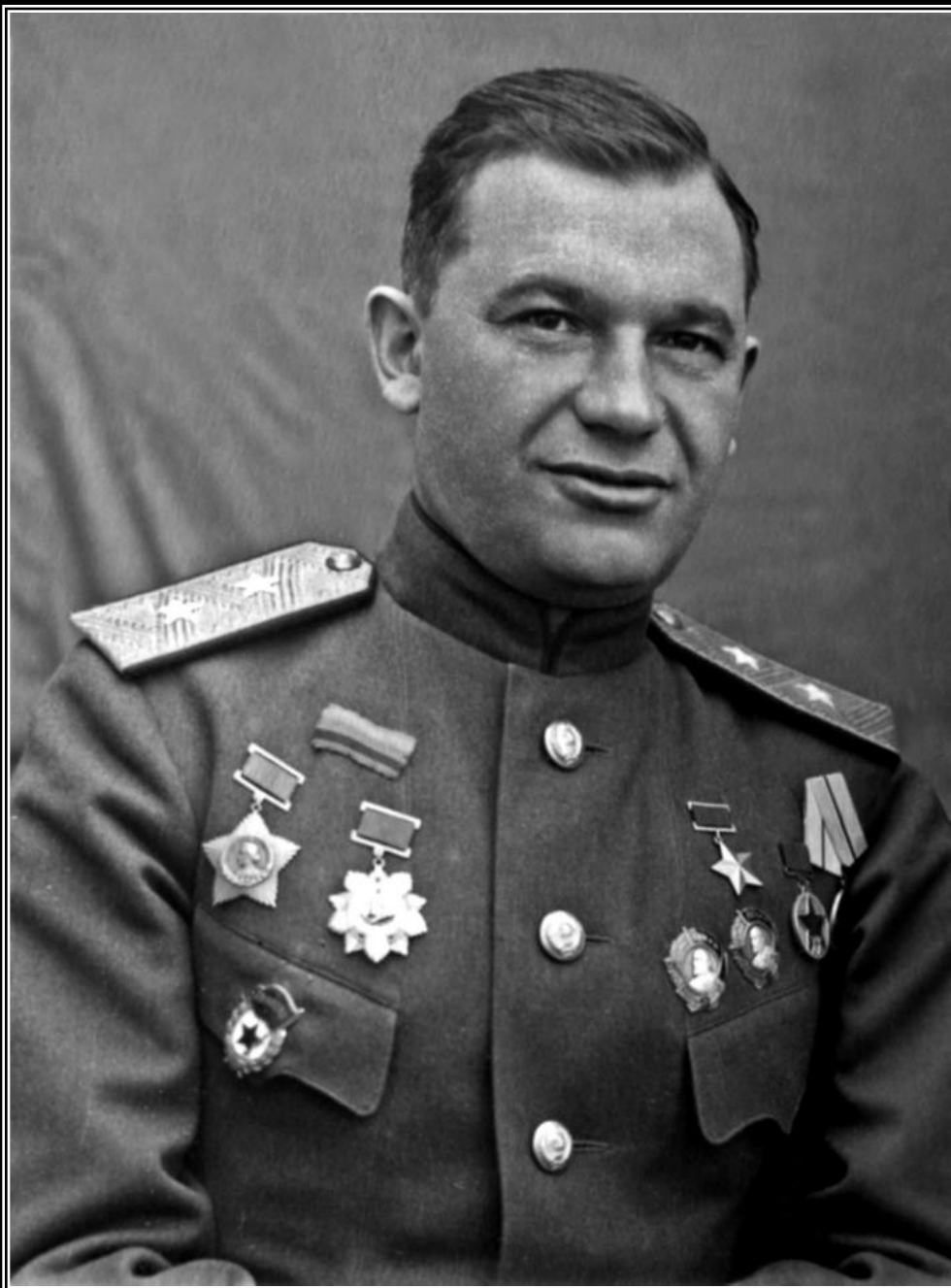
Герой Советского Союза, генерал-лейтенант Я.Г. Крейзер, командующий 51-й армией