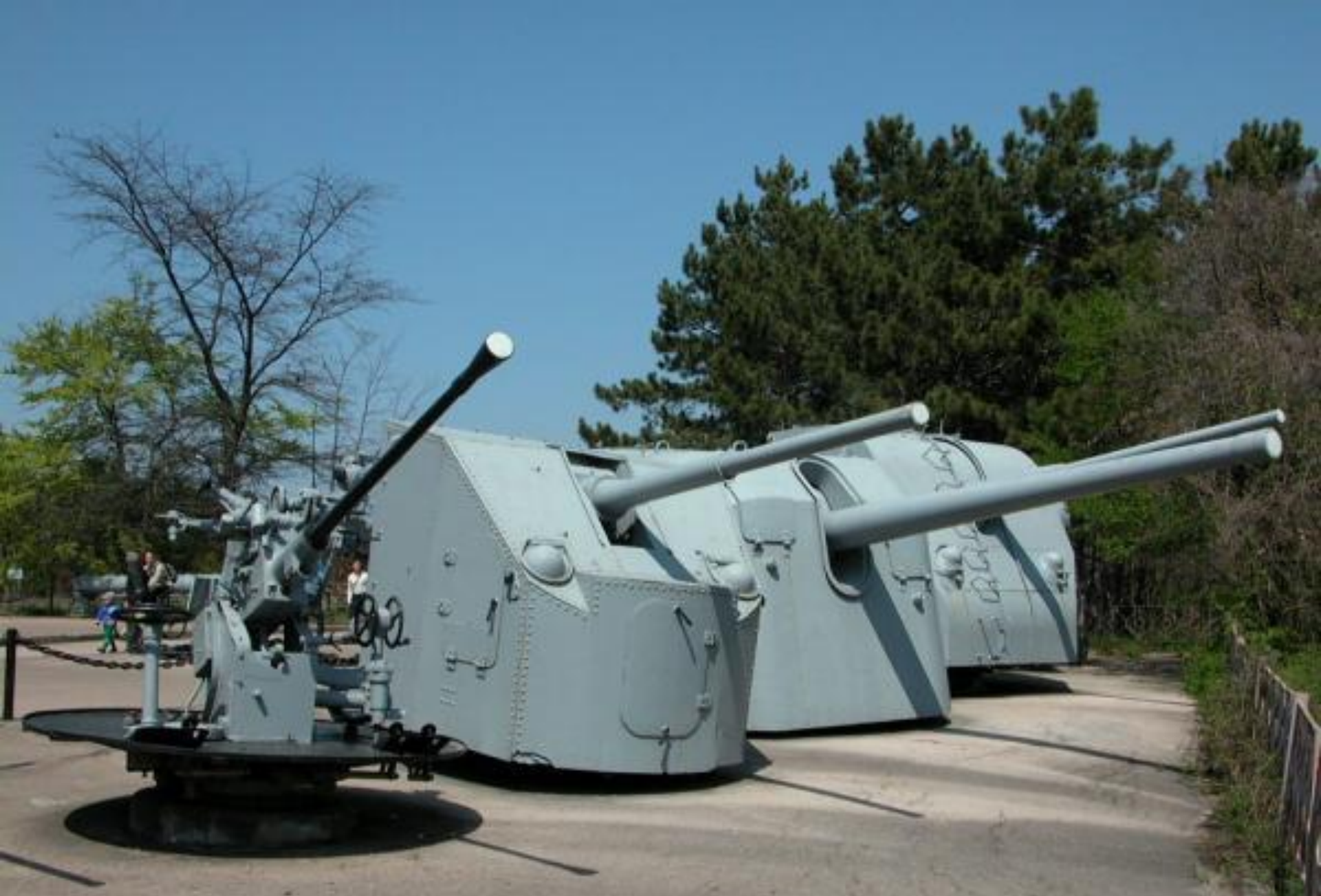
Мемориальный военно-исторический комплекс «Сапун-гора». Открытая экспозиция военно-морской техники. Башенные рубки