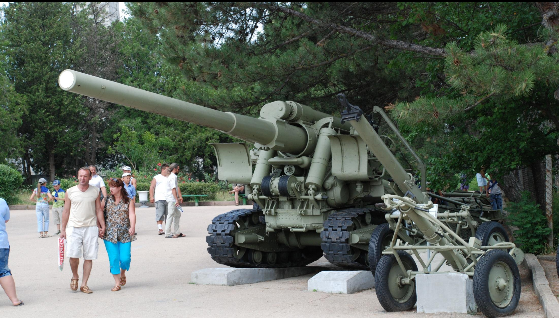
Мемориальный военно-исторический комплекс «Сапун-гора». Открытая экспозиция артиллерийской техники