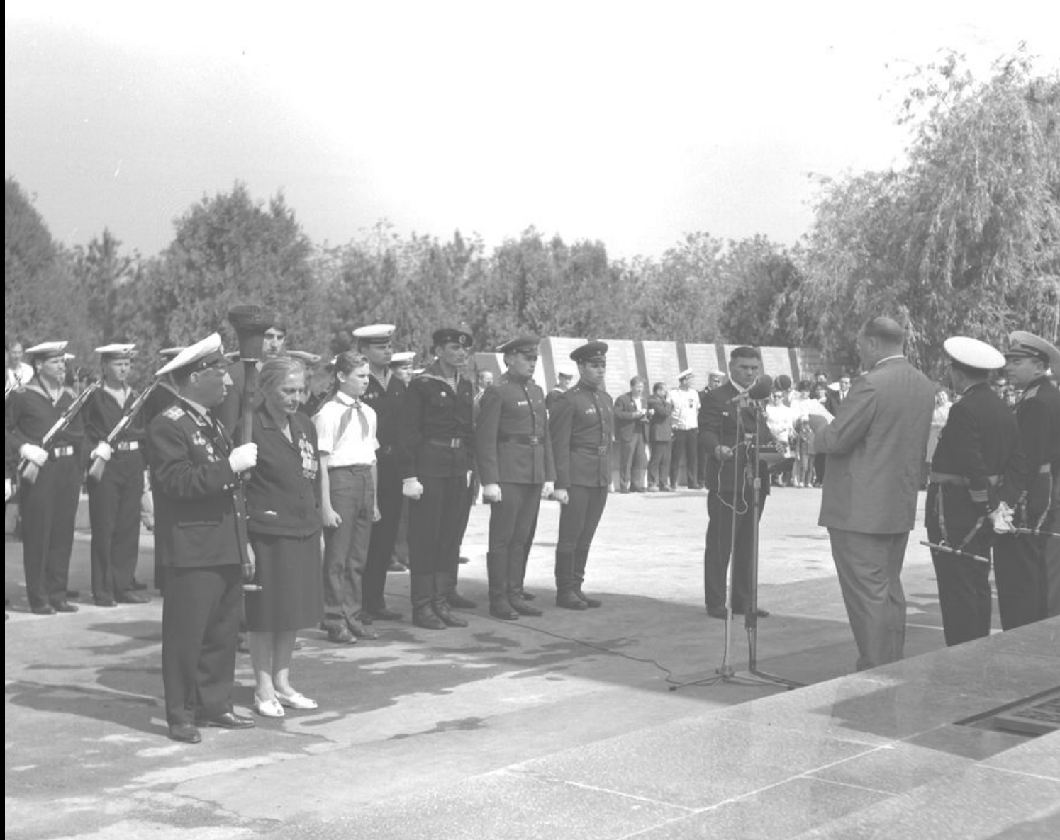
Участники боев за Севастополь Герои Советского Союза полковник Матвеев (освобождение) и прославленный снайпер Л.М. Павличенко у Обелиска Славы на Сапун-горе зажигают Вечный Огонь, доставленный с Малахова кургана. 1970 г.