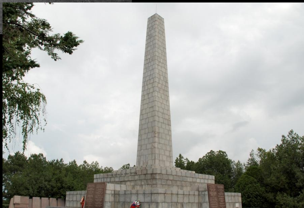
Обелиск Славы на Сапун-горе: 1950-е гг. - слева и 2004 г. - справа