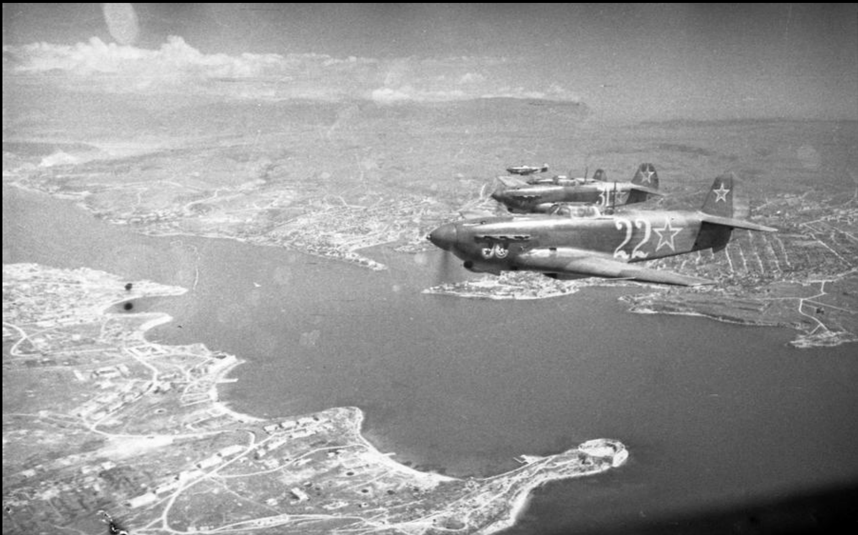
В небе над Севастополем эскадрилья Героя Советского Союза лейтенанта М.Н.Гриба (6 Гвардейский истребительный авиаполк ВВС ЧФ)