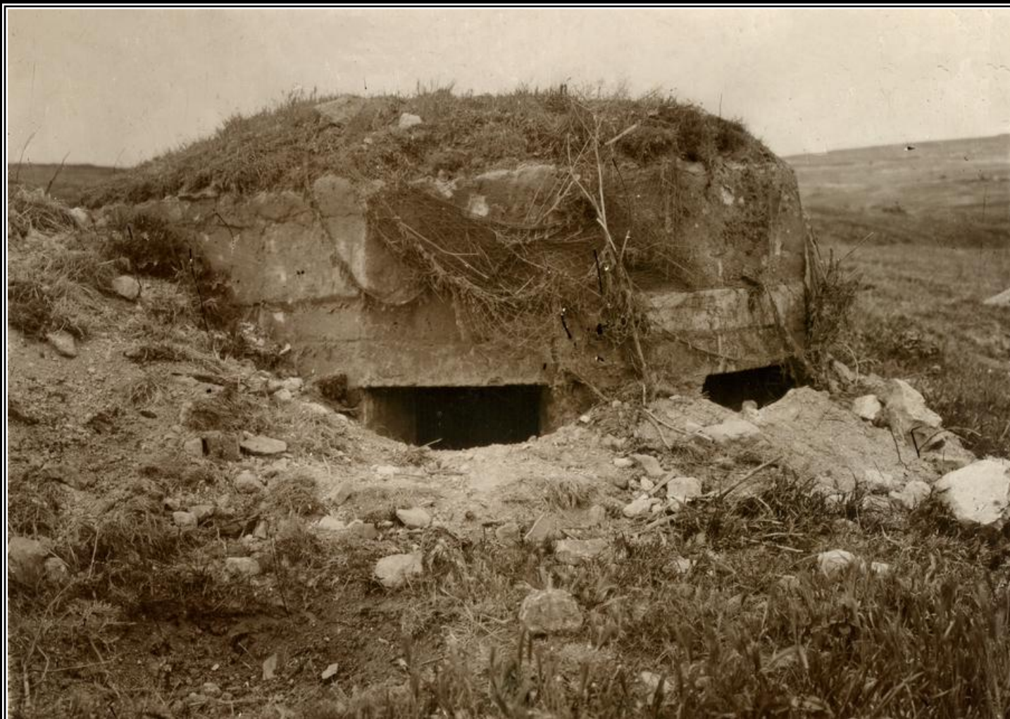
Немецкий ДОТ на Сапун-горе