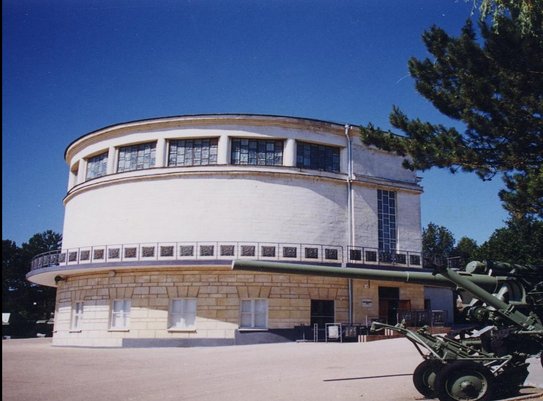
Мемориальный военно-исторический комплекс «Сапун-гора». Здание музея с экспозиционным залом (1 этаж) и Диорамой «Штурм Сапун-горы 7 мая 1944 г.»