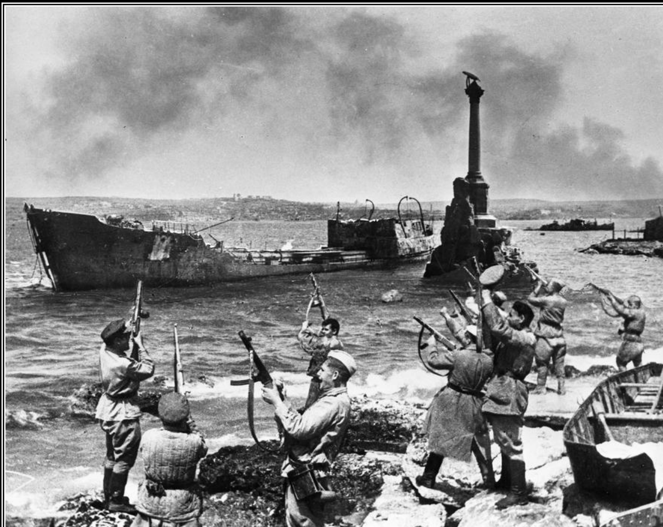
Салют в честь освобождения Севастополя. Приморский бульвар. 9 мая 1944 года