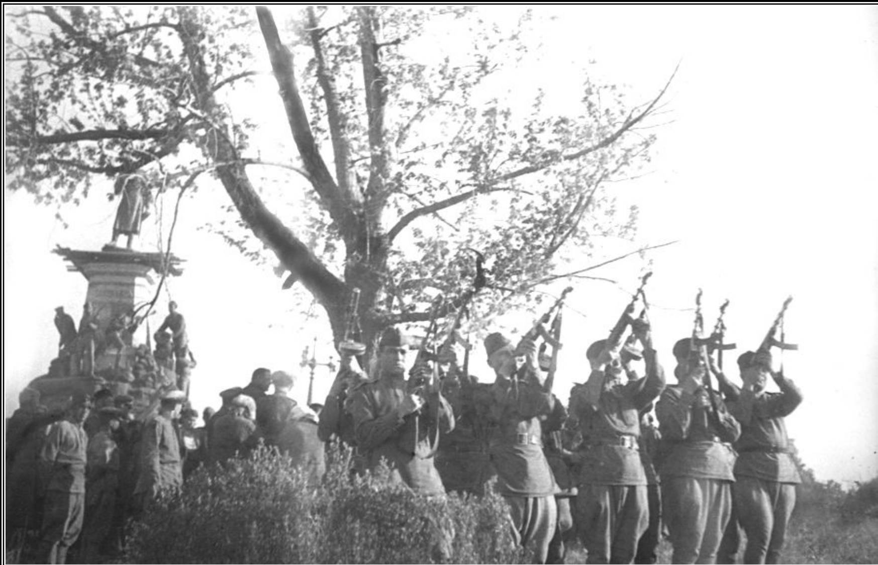
Воинские почести при захоронении советских воинов, погибших в боях за Севастополь. Исторический бульвар. Май 1944 года