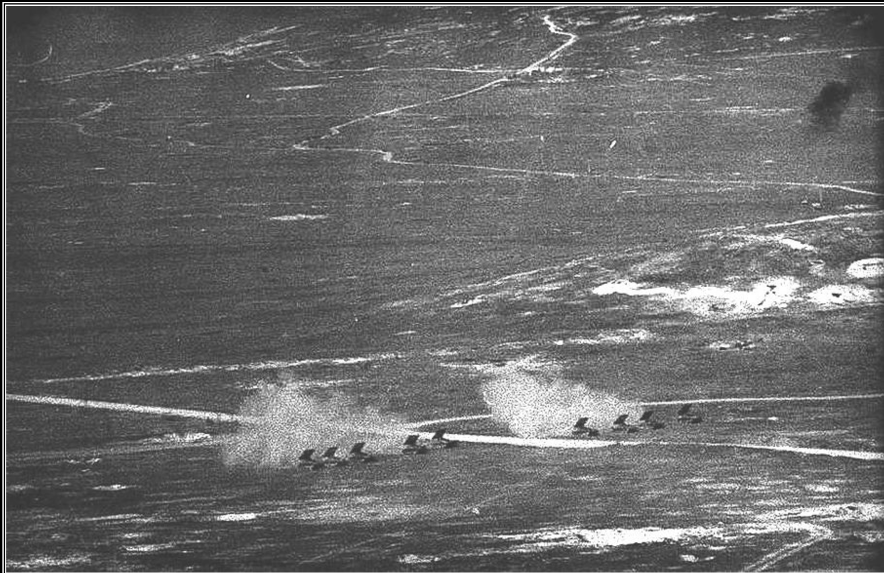
Залп реактивных пусковых установок – гвардейских минометов «Катюша»