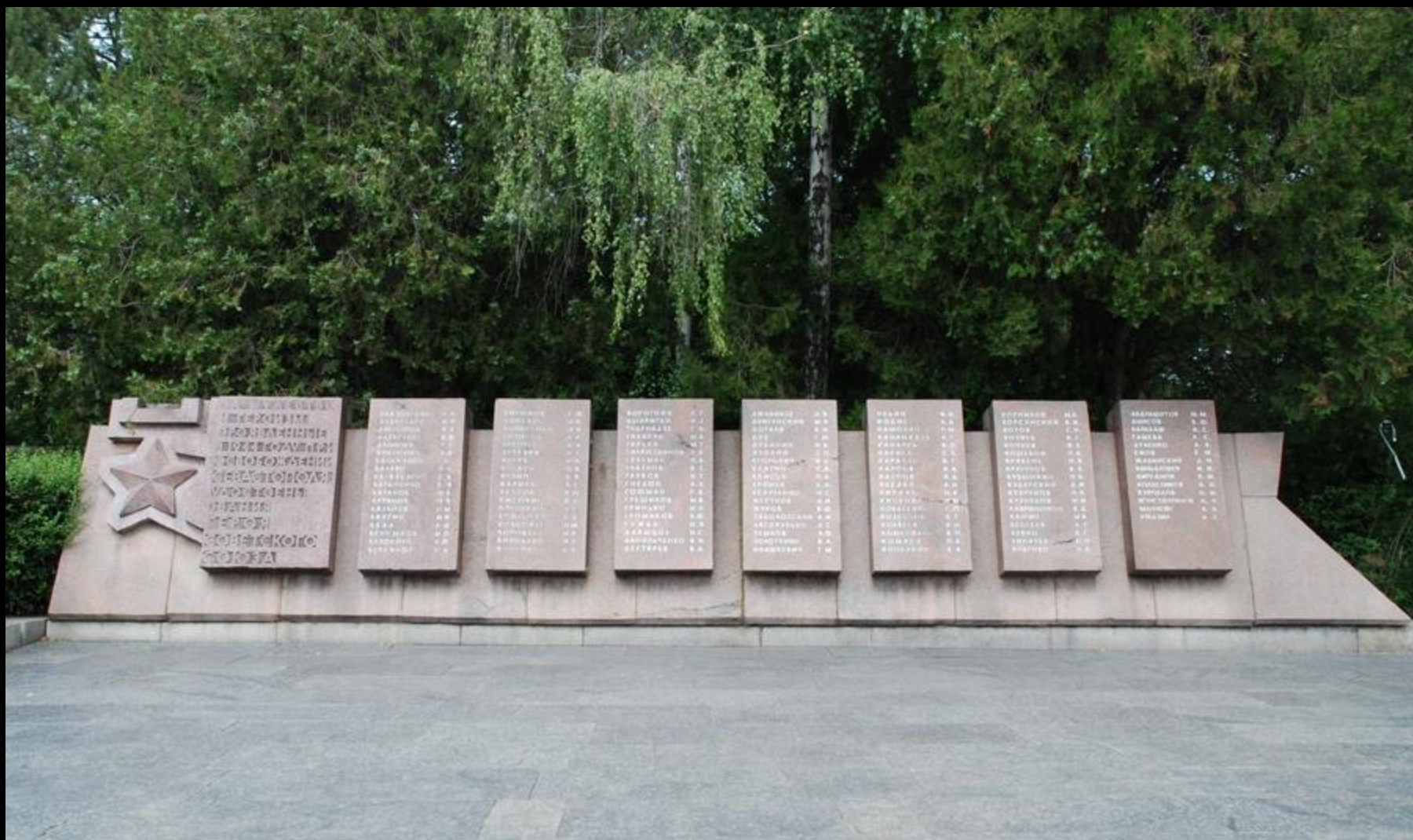
Мемориальные плиты с именами 240 Героев Советского Союза, удостоенных этого звания за освобождение Севастополя