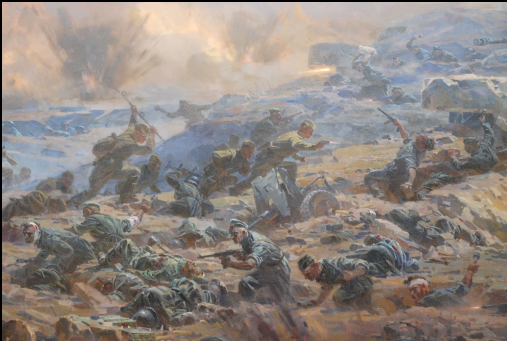
Фрагмент живописного полотна «Капитан В.Ф. Жуков возглавил отражение немецкой контратаки при штурме Сапун-горы». В.Ф. Жуков стреляет из пистолета