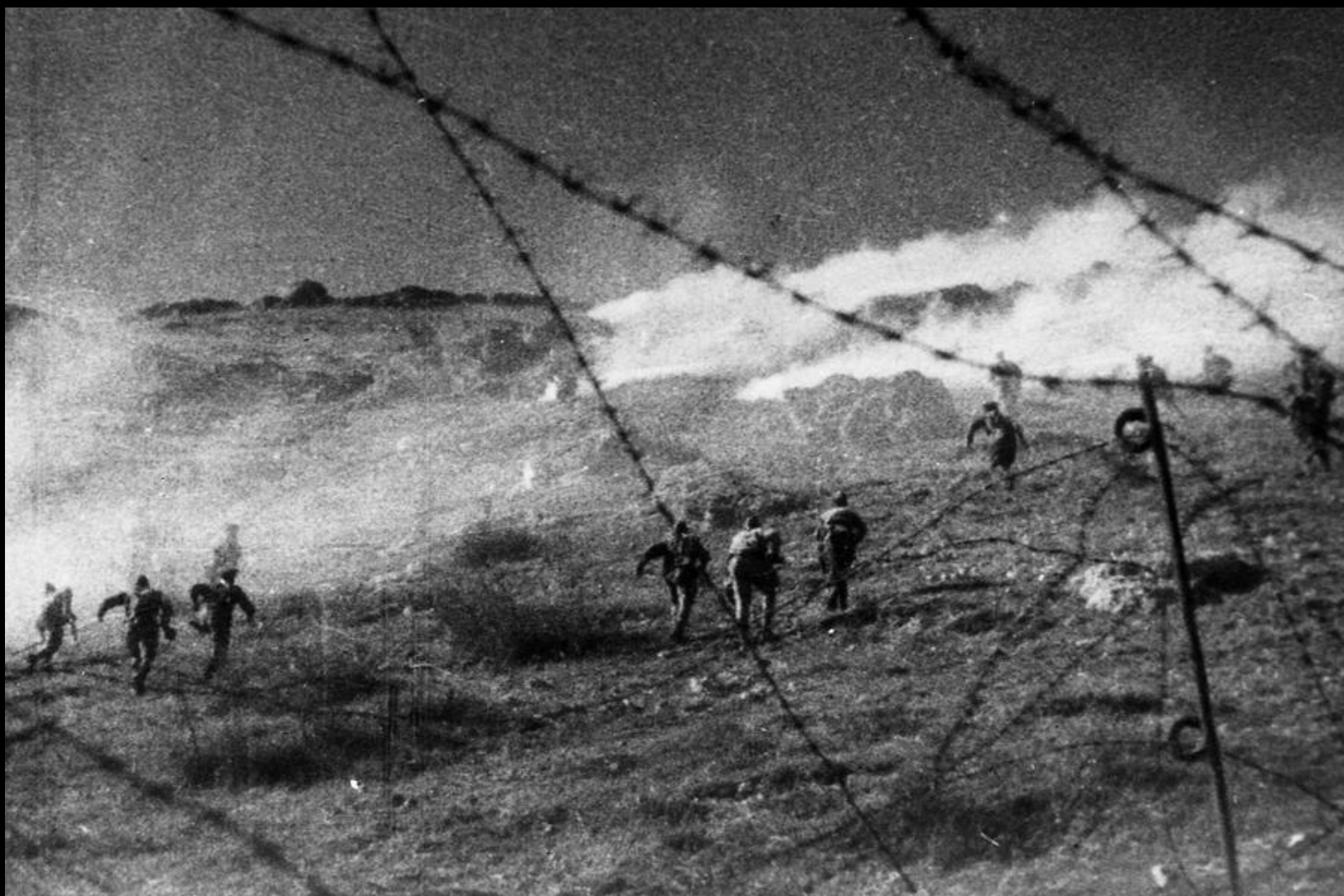
Штурм Сапун-горы 7 мая 1944 г. Кадр военной хроники