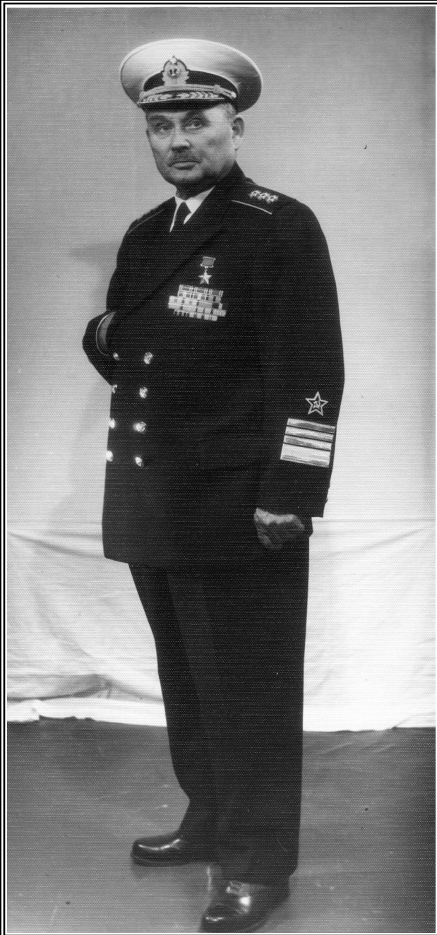
Командующий Черноморским флотом адмирал Ф.С. Октябрьский.