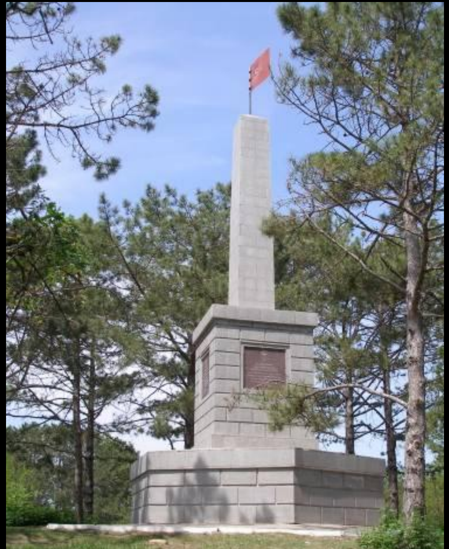
Памятник воинам 51-й армии. 1944 г. (слева) и 2004 г. (справа)