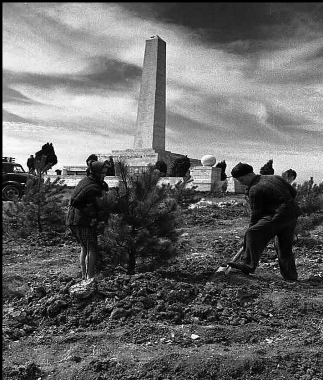
Закладка парка на Сапун-горе. 1957 г.