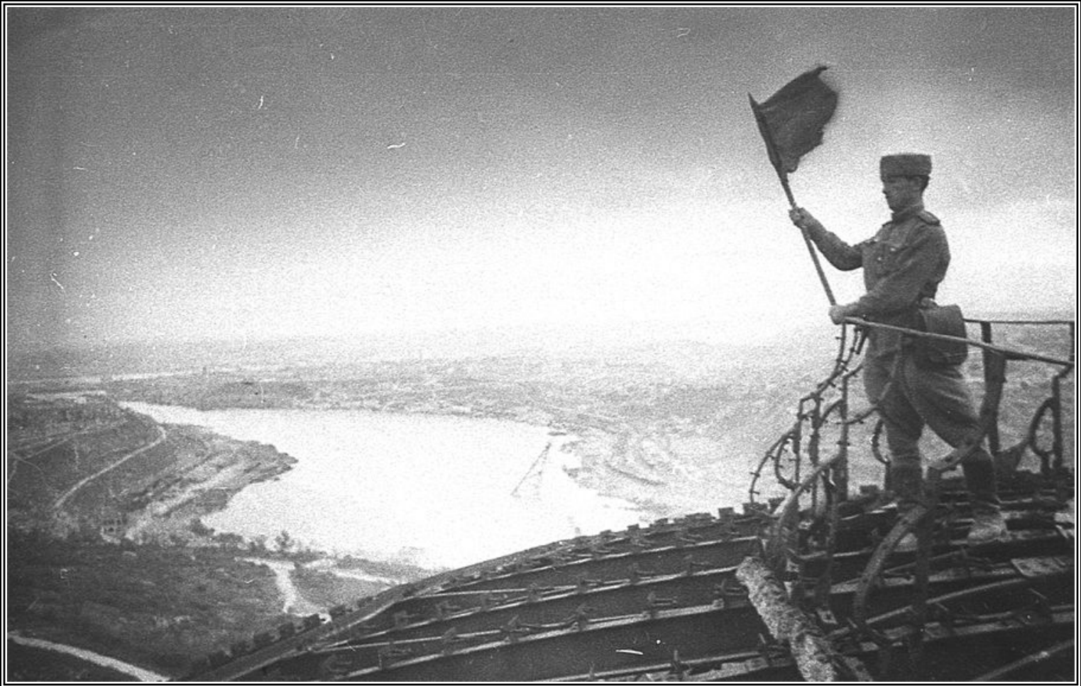
Водружение штурмового флага на здании Панорамы.