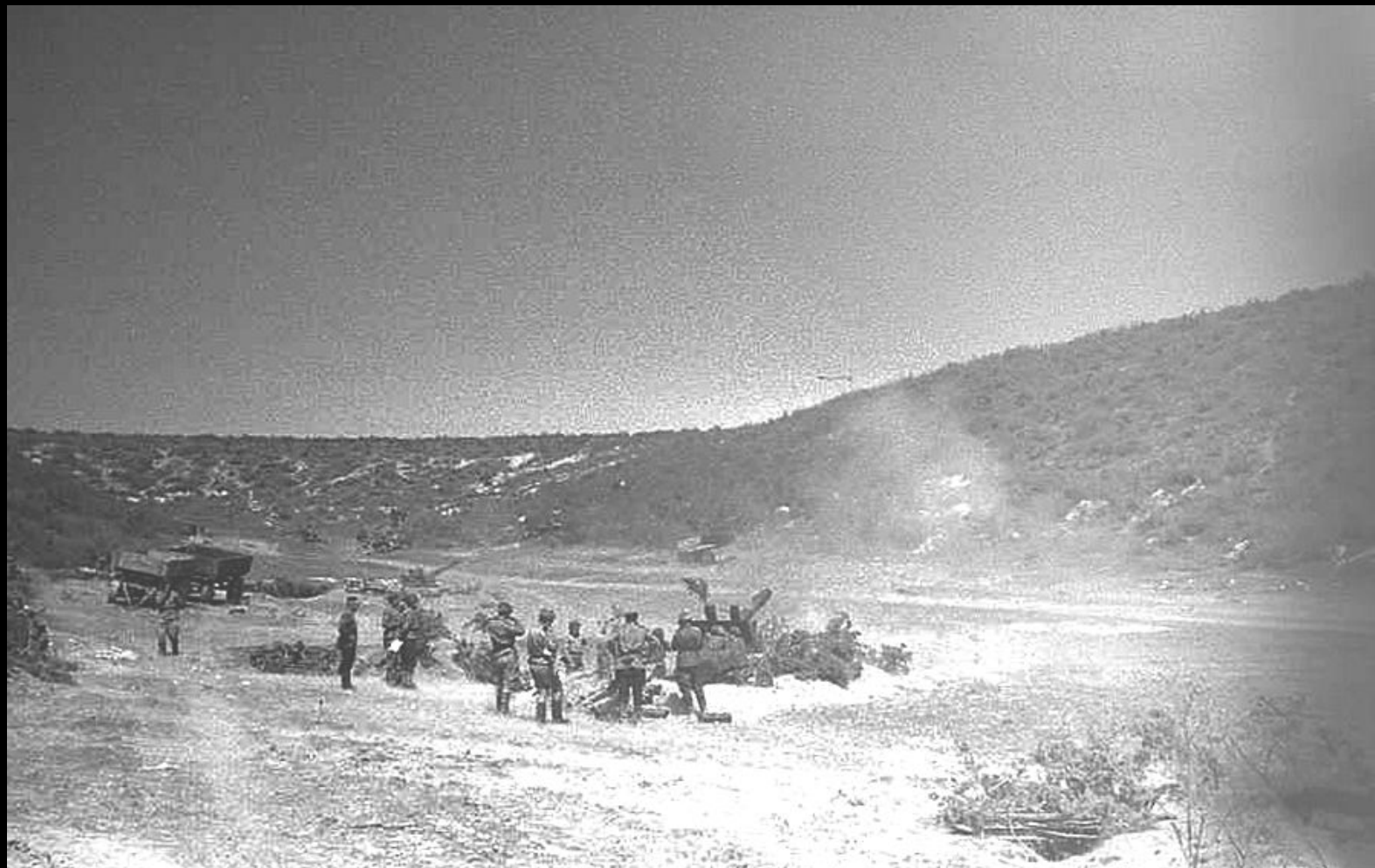
Артиллерийская подготовка перед штурмом Сапун-горы