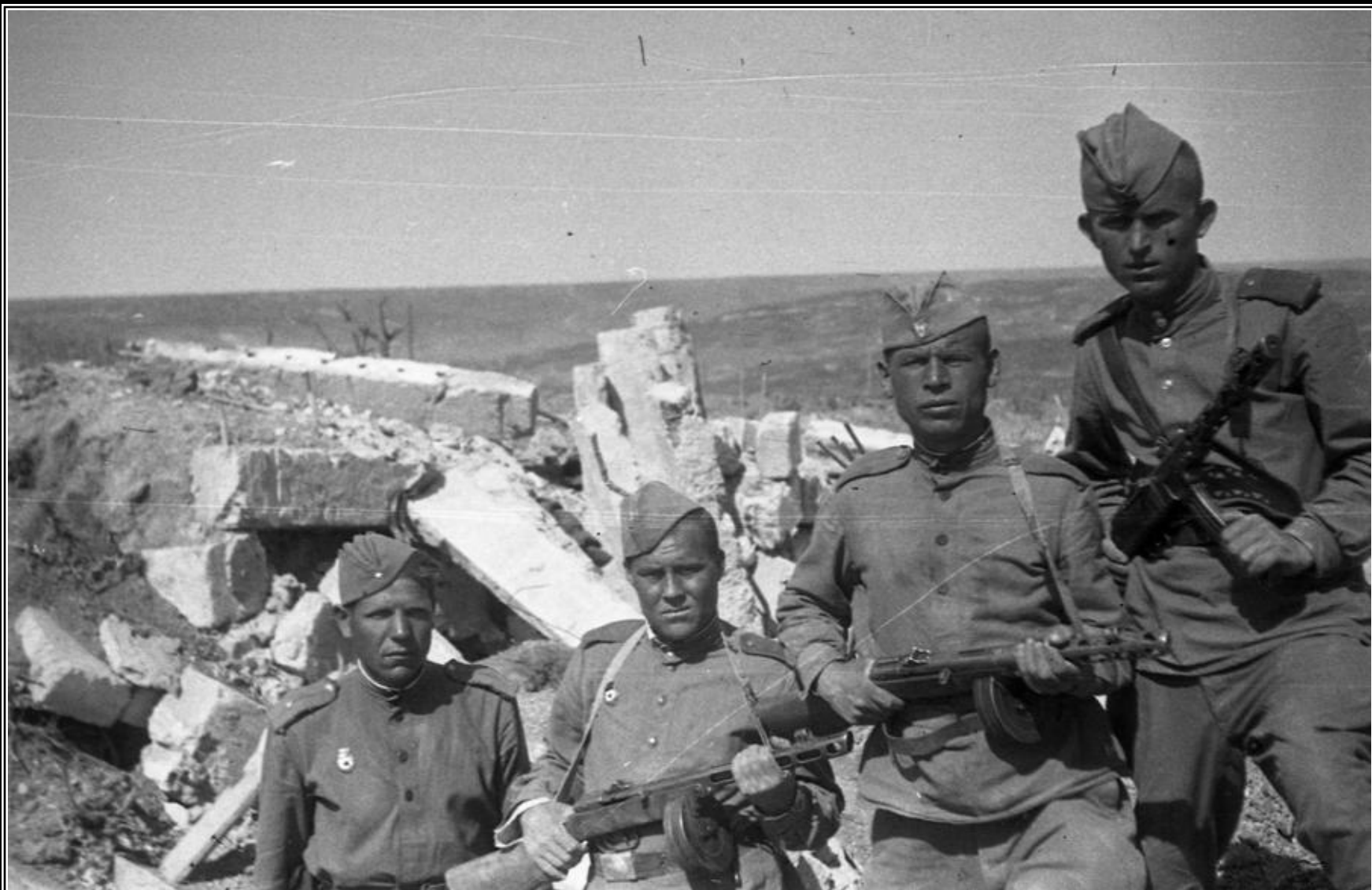
Участники штурма Сапун-горы 7 мая 1944 года разрушенных позициях противника