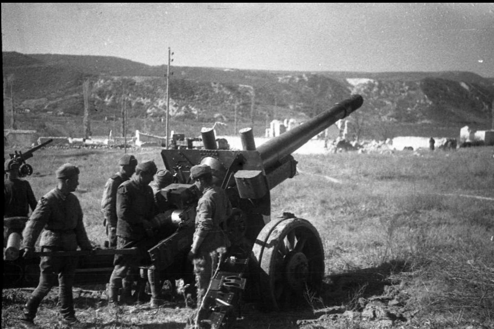
Артиллеристы ведут огонь по оборонительным рубежам противника