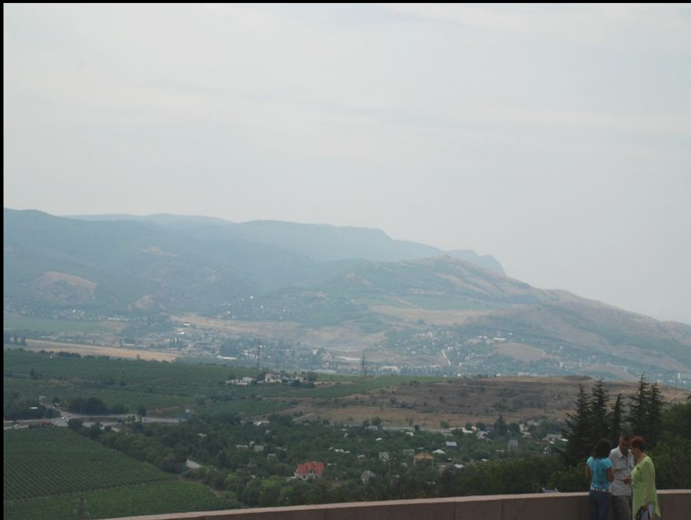
Вид со смотровой площадки мемориального военно-исторического комплекса «Сапун-гора» на Балаклавскую долину, прилегающие к ней высоты