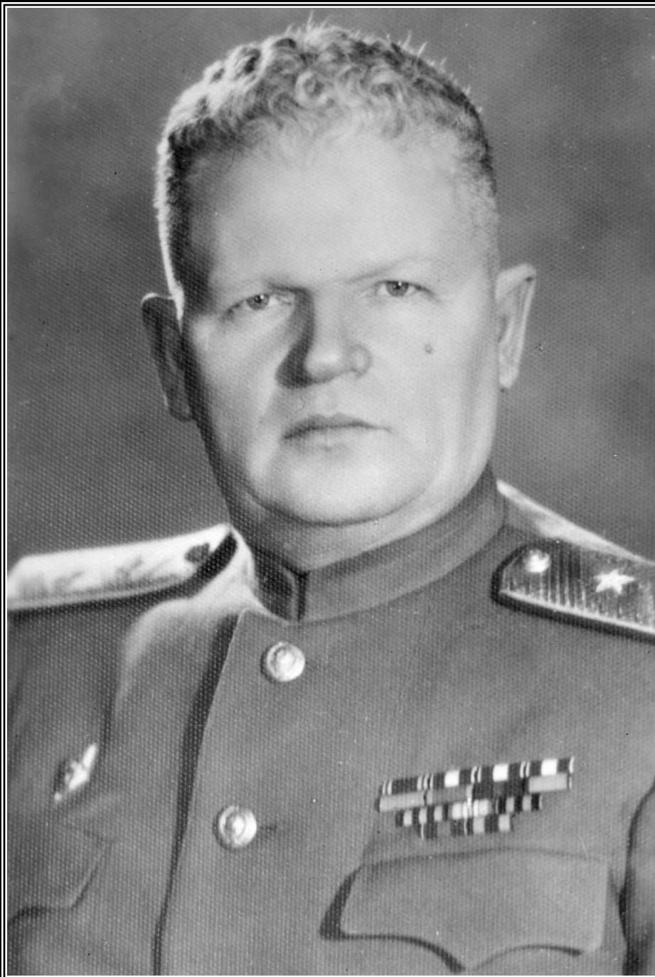
Командующий Приморской армией генерал-лейтенант К.С. Мельник