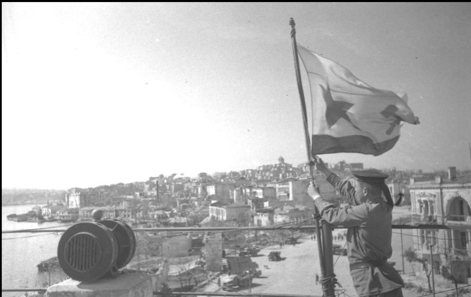
Водружение Военно-морского флага на здании водно-спортивной станции