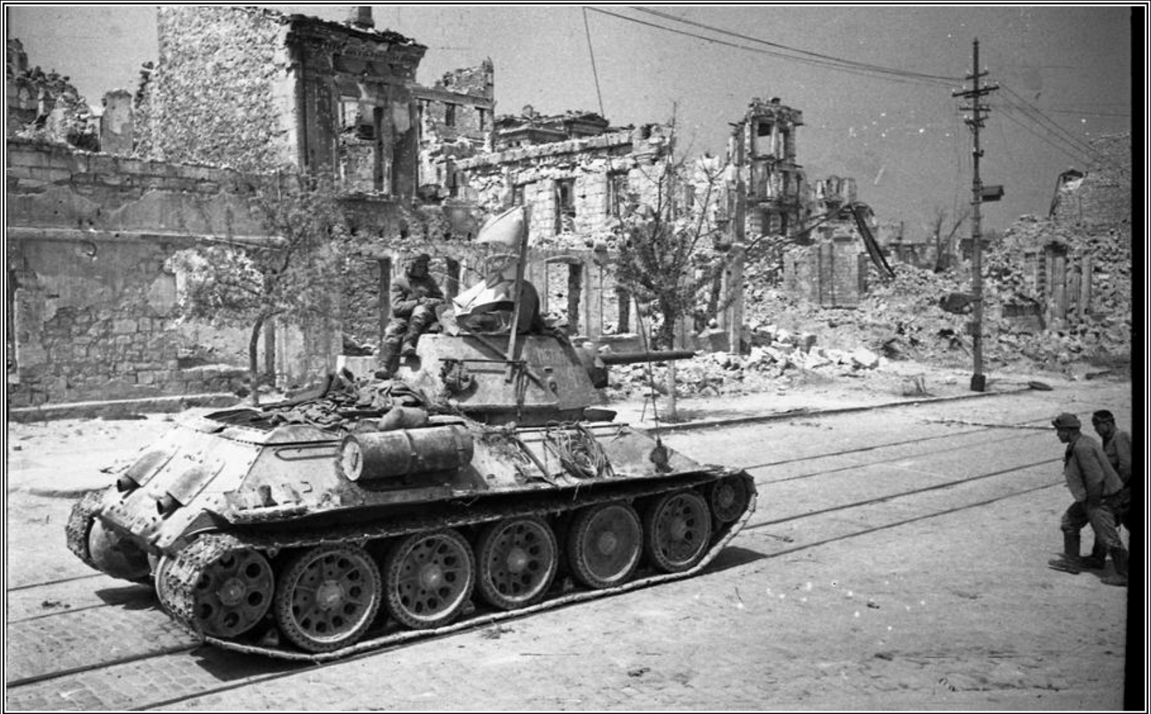
Бронетанковая техника 4-го Украинского фронта в освобожденном Севастополе. Улица Ленина.