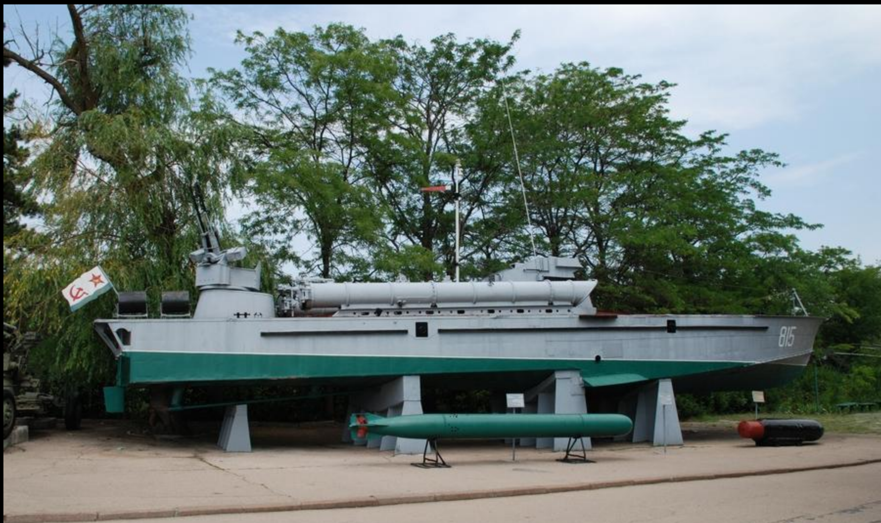
Мемориальный военно-исторический комплекс «Сапун-гора». Торпедный катер типа «Комсомолец»