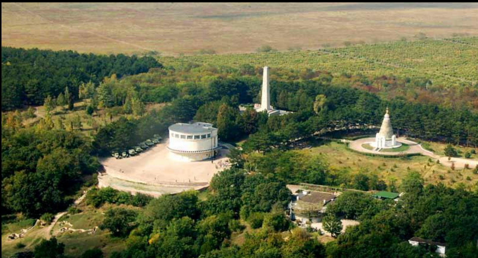
Мемориальный военно-исторический комплекс «Сапун-гора»