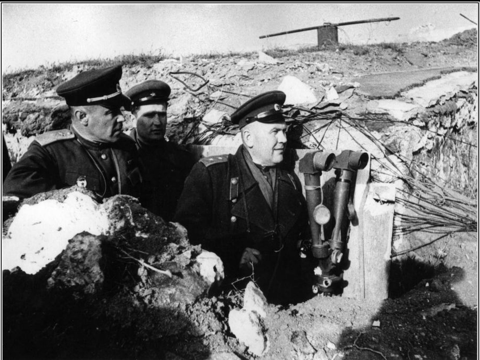
Командующий 2-й Гвардейской армией генерал-лейтенант Г.Ф. Захаров (у стереотрубы)