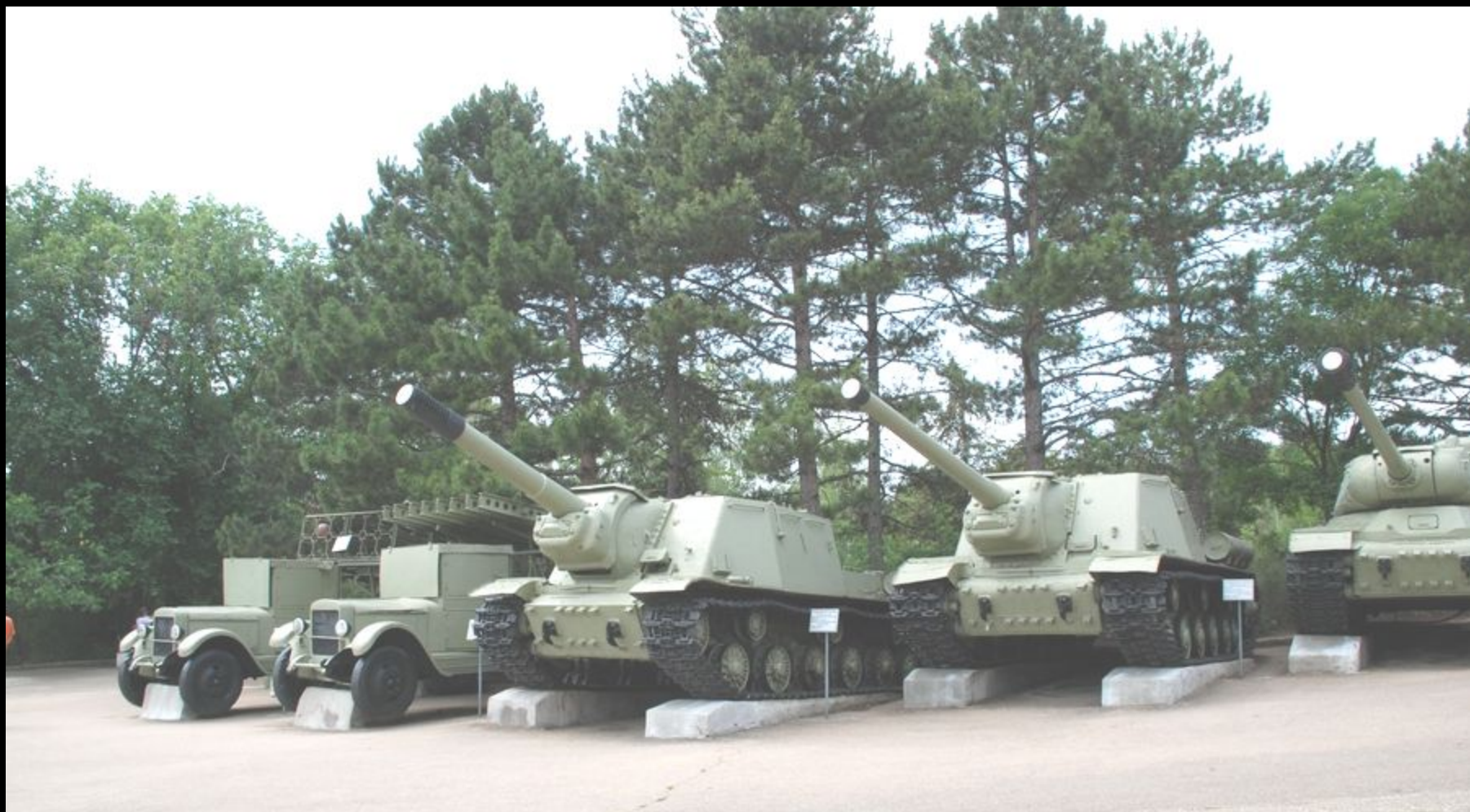
Мемориальный военно-исторический комплекс «Сапун-гора». Открытая экспозиция образцов пусковых установок реактивной артиллерии, бронетанковой техники