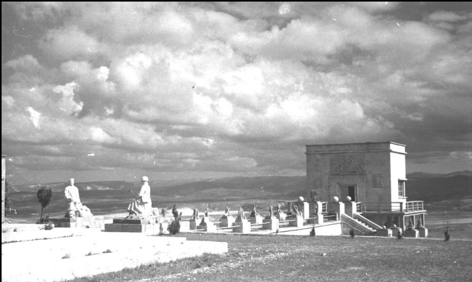
Военно-полевой музей на Сапун-горе. 1946 г.