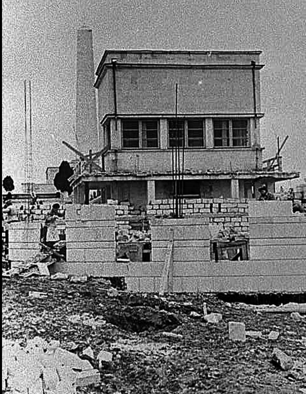
Строительство здания для диорамы. 1958 г.