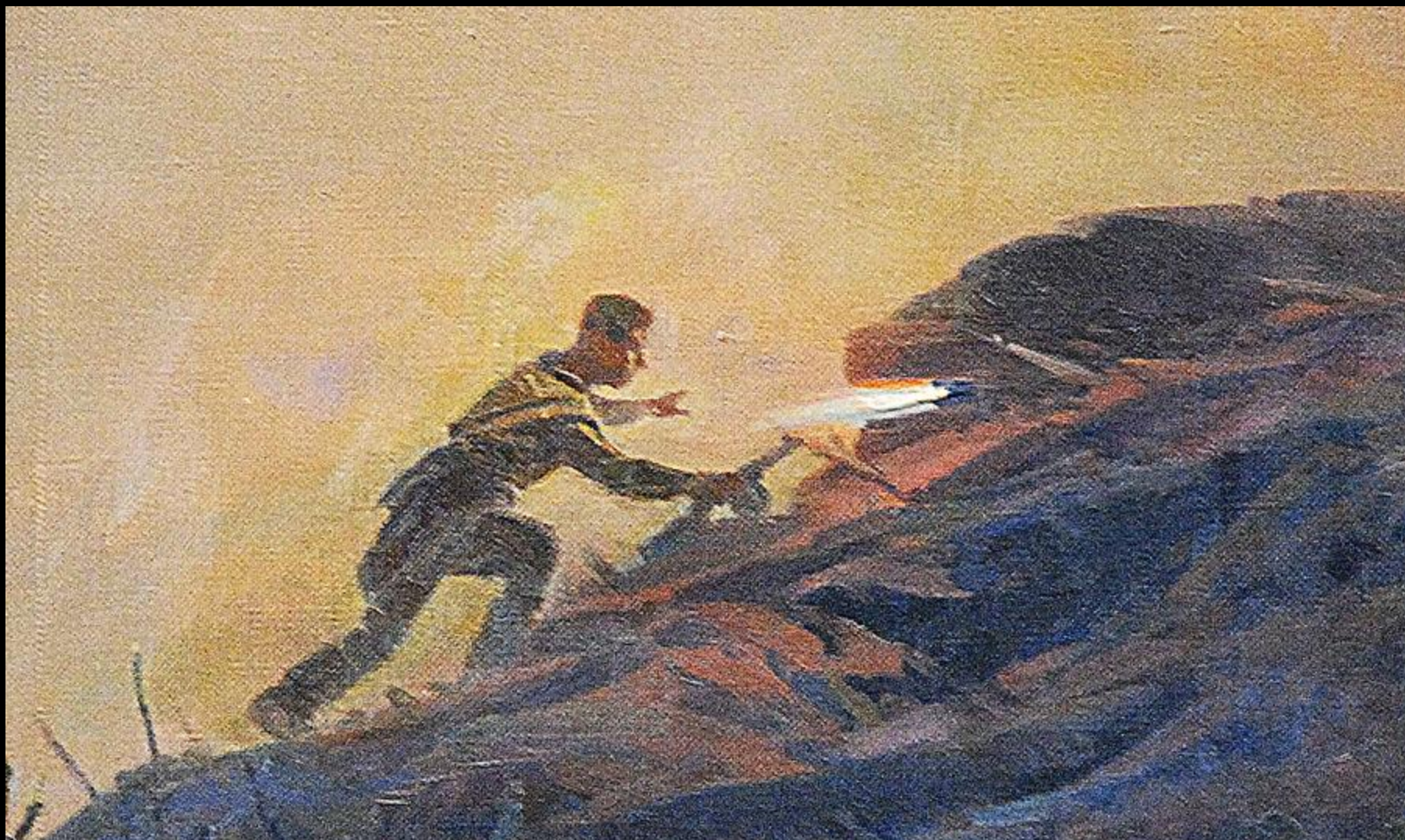
Фрагмент живописного полотна диорамы «Подвиг Михаила Дзигунского»