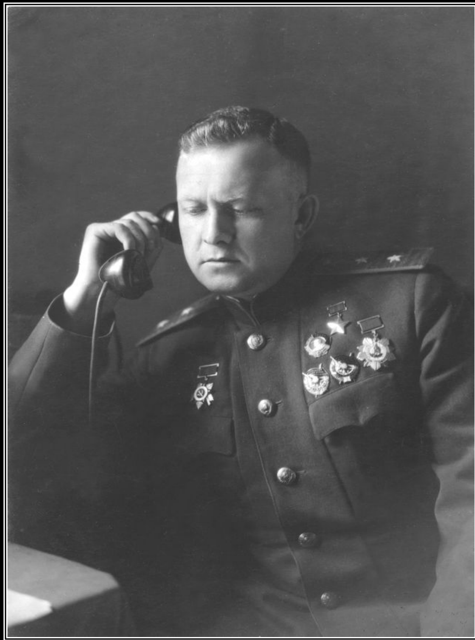
Командующий 8 воздушной армией генерал-лейтенант Т.Т. Хрюкин