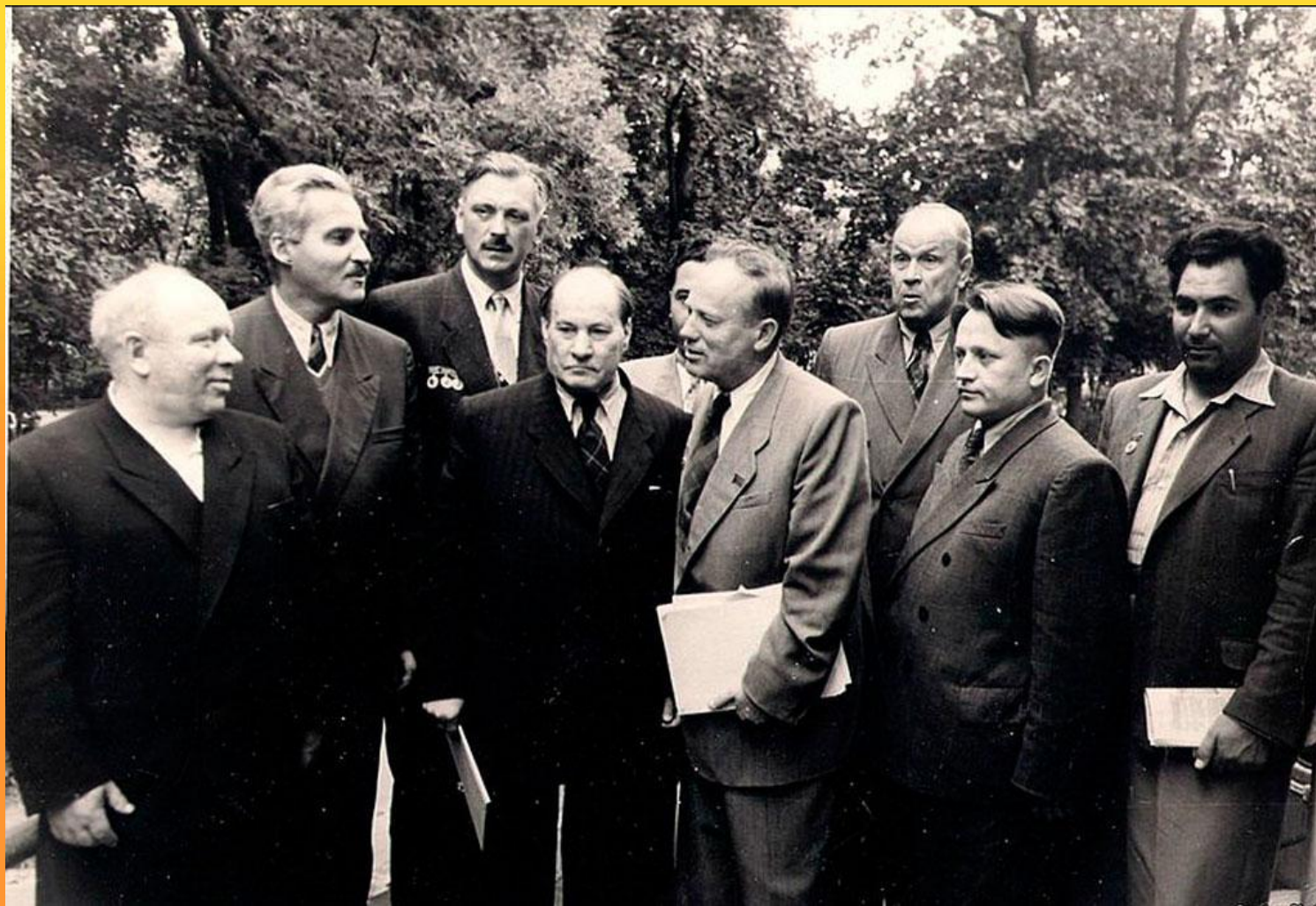
А. Прокофьев (1-й слева) на III съезде писателей БССР