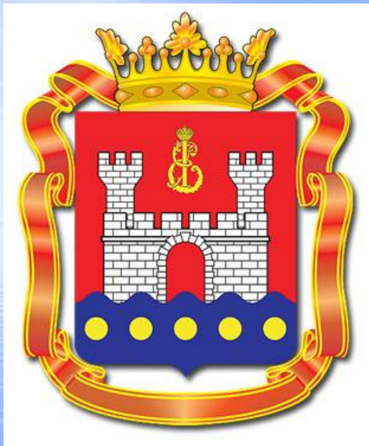
Герб Калининградской области