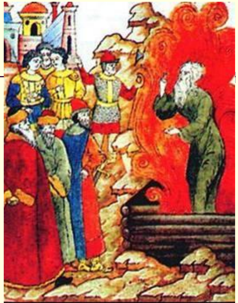
Сожжение протопопы Аввакума. Миниатюра к.17 в.