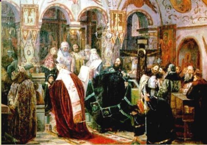
Лишение Никона на Соборе Патриаршего сана. Неизвестный художник. (19 век).