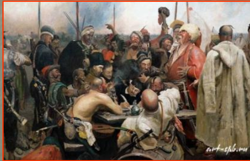
И.Репин «Запорожцы пишут письмо турецкому султану»