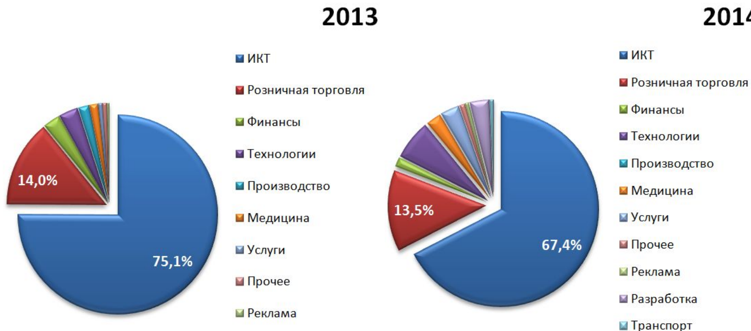
Рис. 5. Отраслевая структура сделок в количественном выражении в 2013-2014 гг., %