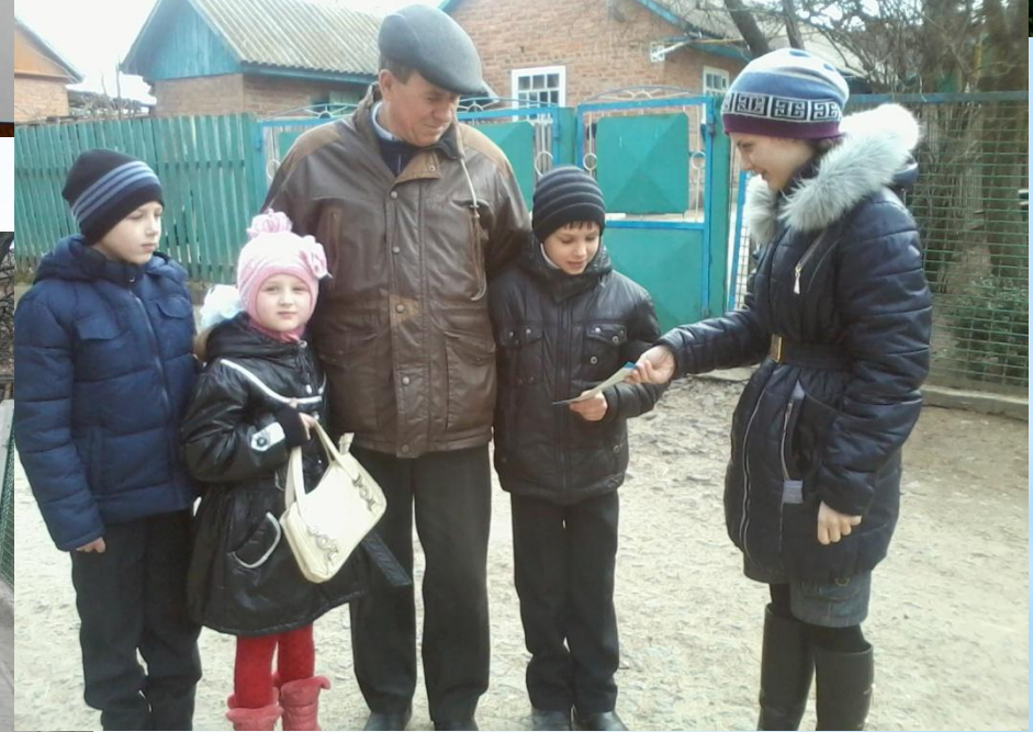
Створення тематичного буклету та поширення серед місцевих жителів