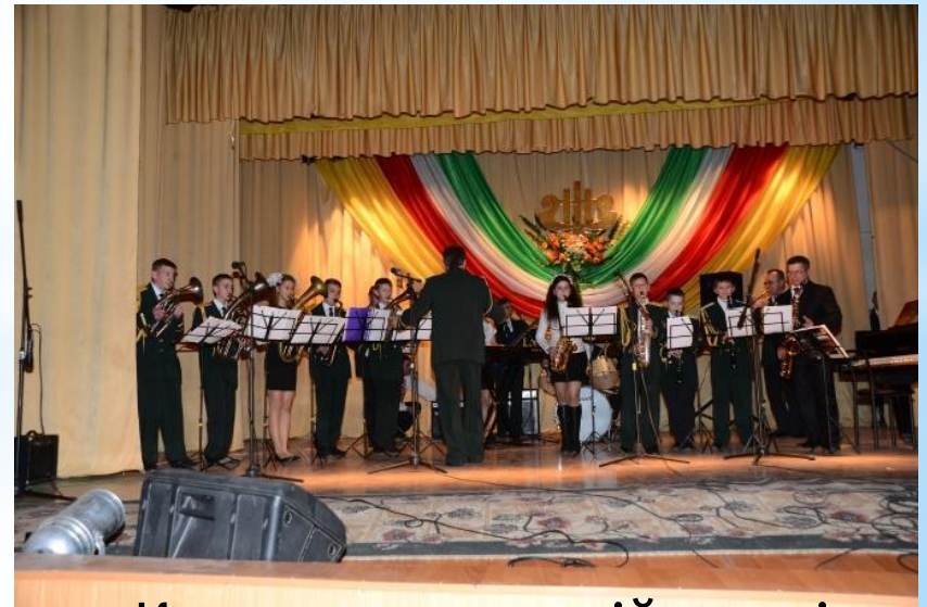
Концерт у музичній школі