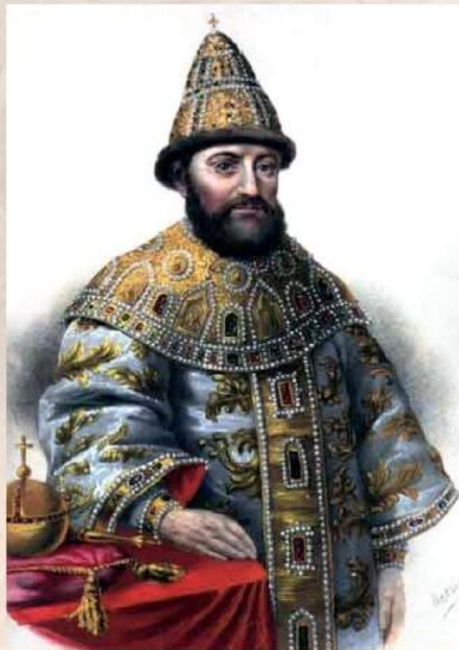
Царь Михаил Федорович

С 1619 до 1633 г. фактическим соправителем Михаила стал его отец патриарх Филарет