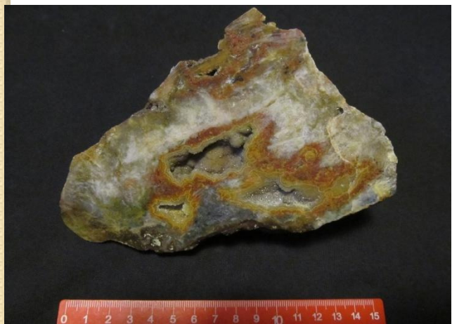
дер. Кондобережская, Медвежьегорский р-н.