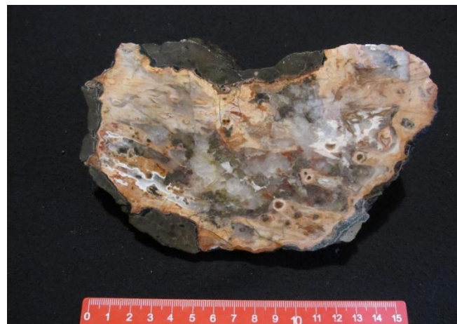
Салминское проявление, Питкярантский р-н.