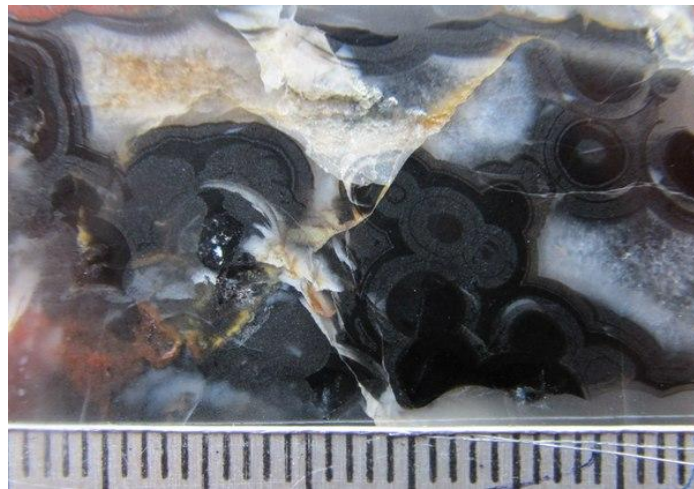
Суйсарь, Прионежский р-н.