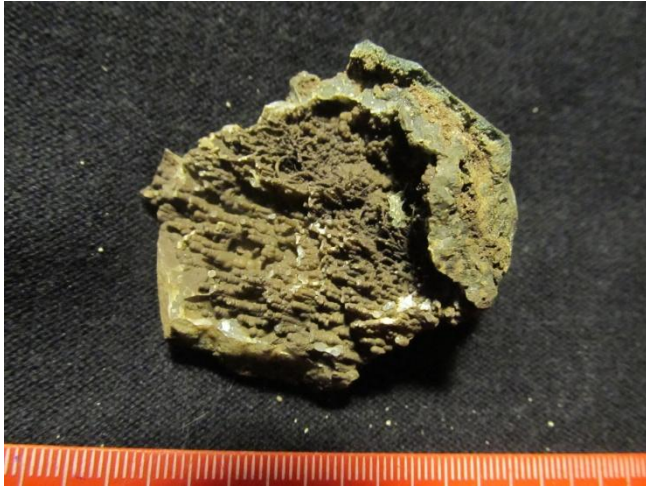
Ялгуба, Прионежский р-н.