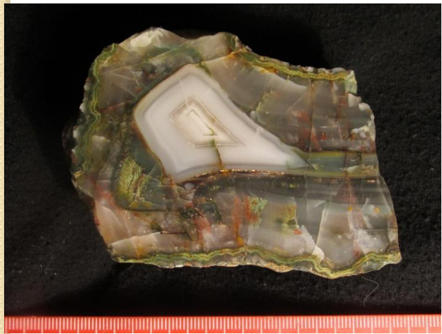
Пиньгуба, Прионежский р-н.