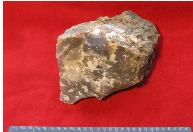
Суйсарь , Прионежский р-н.