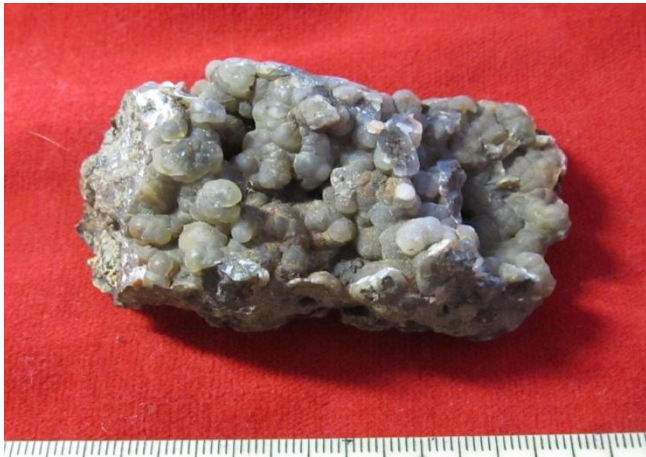
Пиньгуба, Прионежский р-н.