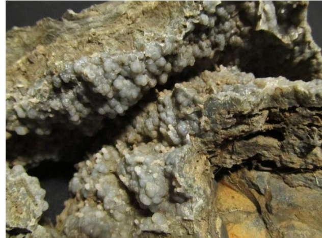
Ялгуба, Прионежский р-н.