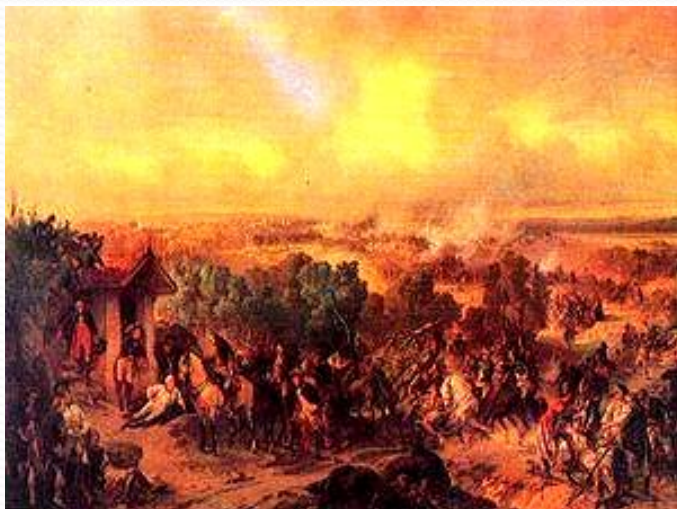
СРАЖЕНИЕ при ТРЕББИИ