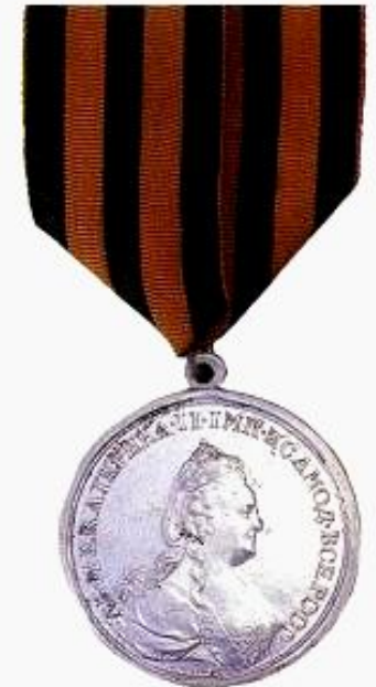
МЕДАЛЬ ЗА СРАЖЕНИЕ ПОД КИНБУРНОМ