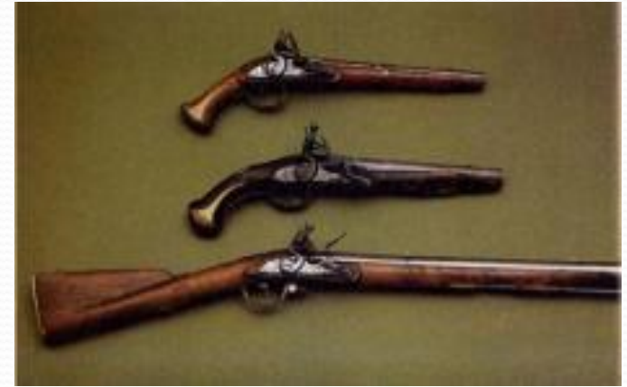
ОРУЖИЕ РУССКОЙ КОННИЦЫ