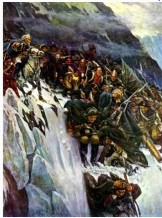
СПУСК В ДОЛИНУ