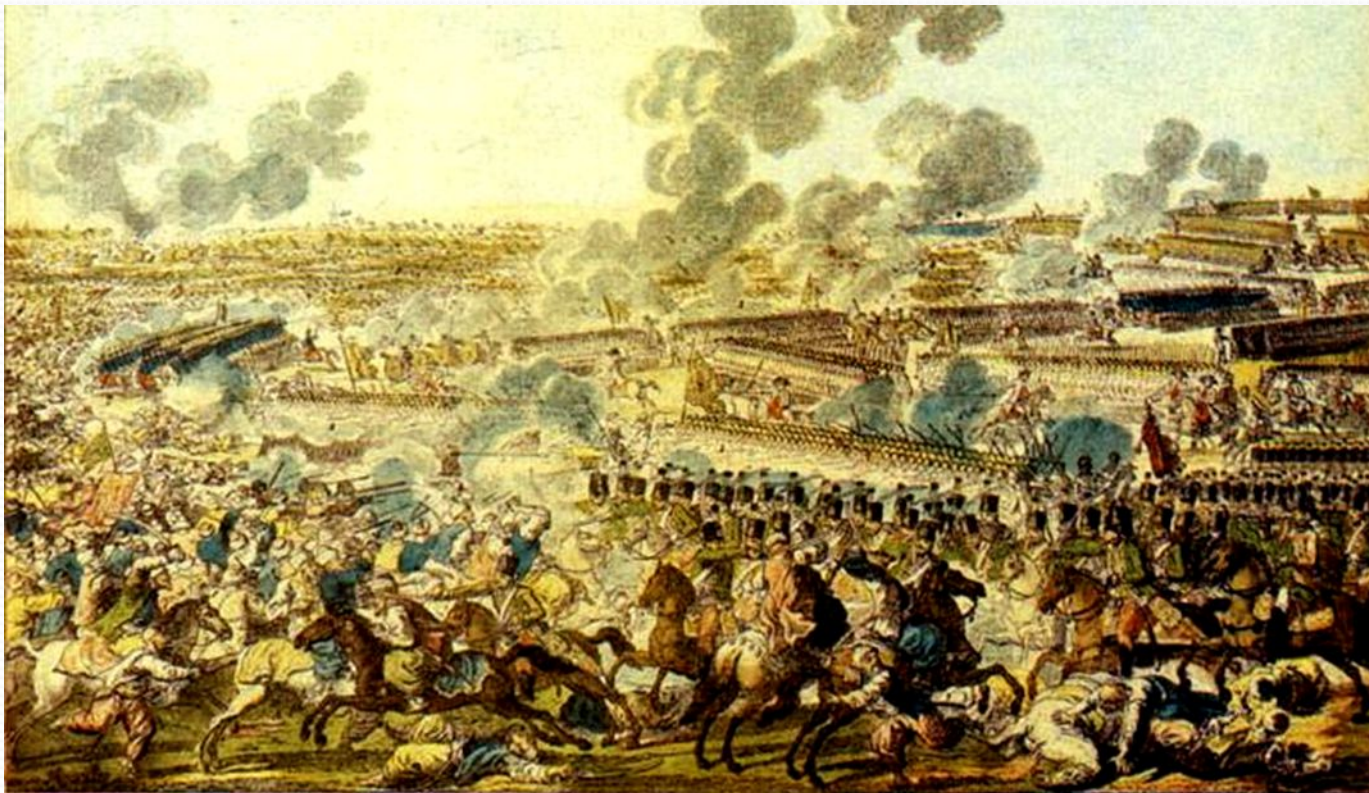
СРАЖЕНИЕ ПРИ РЫМНИКЕ 11 сентября 1789 г.