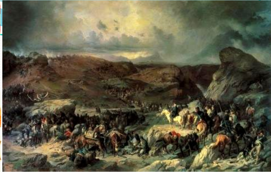
ПЕРЕХОД ЧЕРЕЗ СЕНТ-ГОТАРД