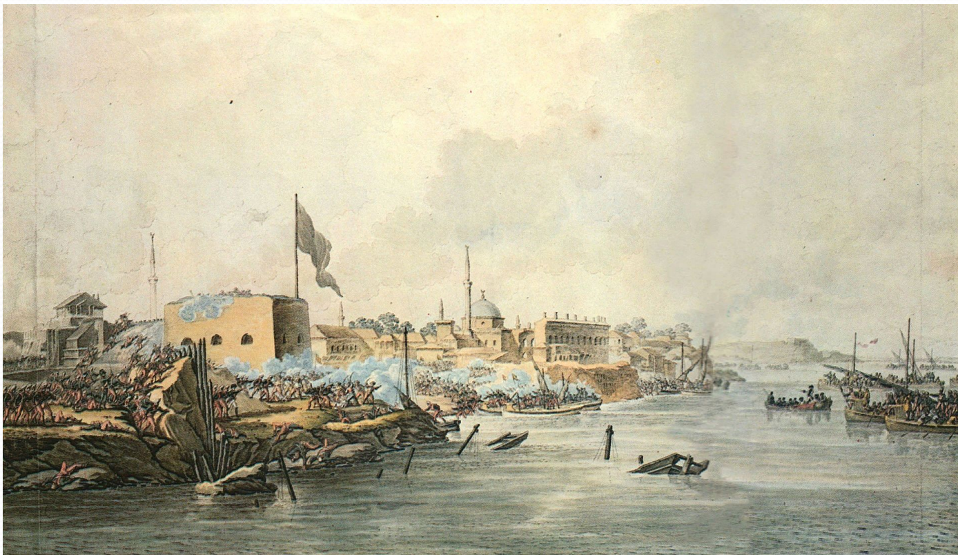
Штурм Измаила 1790 г.