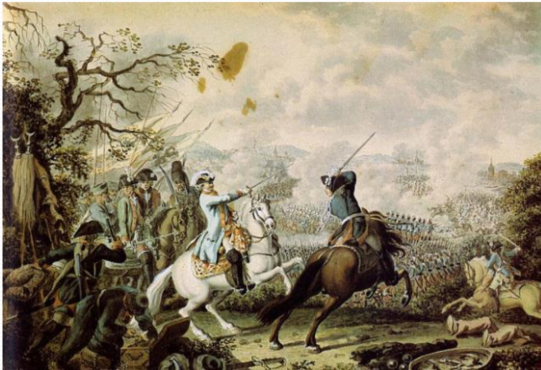
СРАЖЕНИЕ ПРИ КАГУЛЕ 21 июля 1770 г.