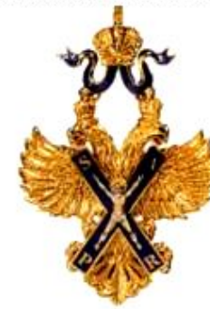
ОРДЕН И ЗНАК СВЯТОГО АПОСТОЛА АНДРЕЯ ПЕРВОЗВАННОГО