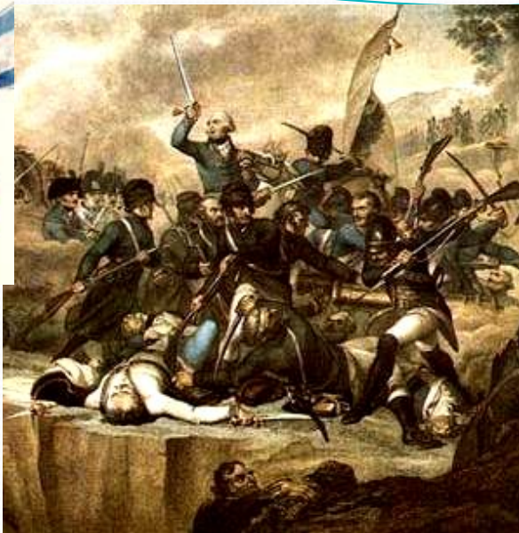
СРАЖЕНИЕ при р. АДДЕ