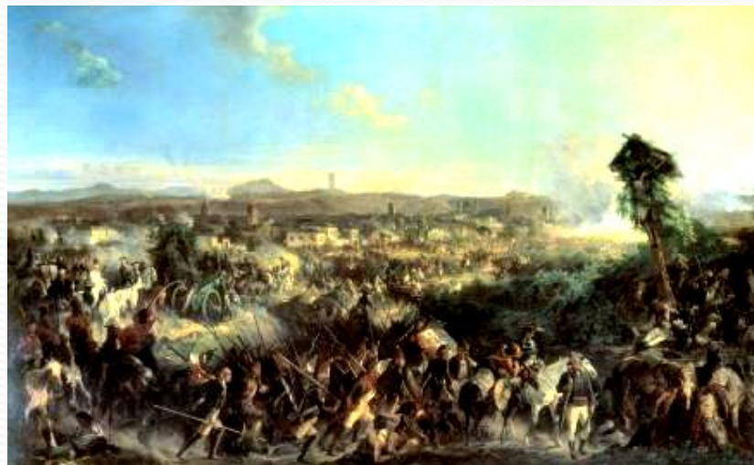
СРАЖЕНИЕ при НОВИ