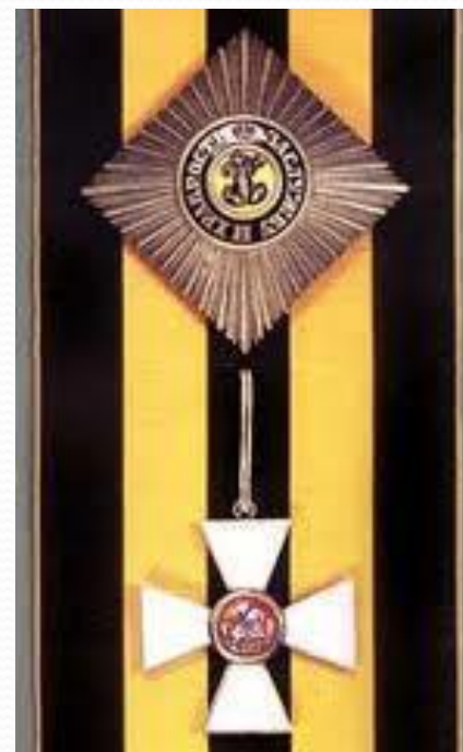
ОРДЕН СВЯТОГО ГЕОРГИЯ 1-Й СТЕПЕНИ