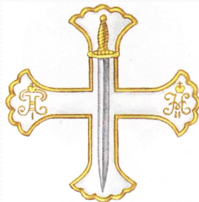
Знак лейб-гвардии Семеновского полка