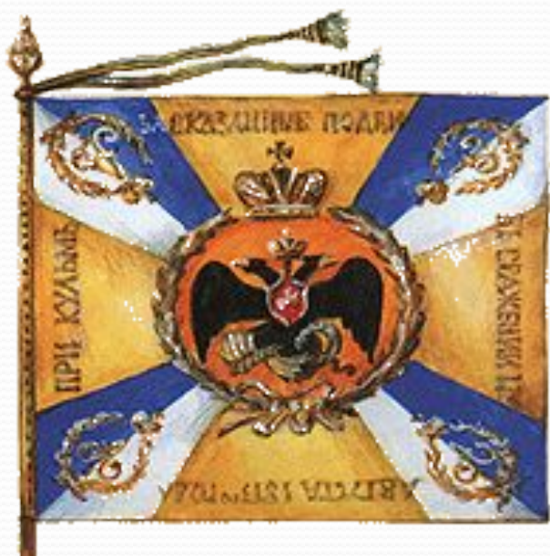
Боевое знамя полка

В 1742 году был зачислен мушкетёром в лейб-гвардии Семёновский полк