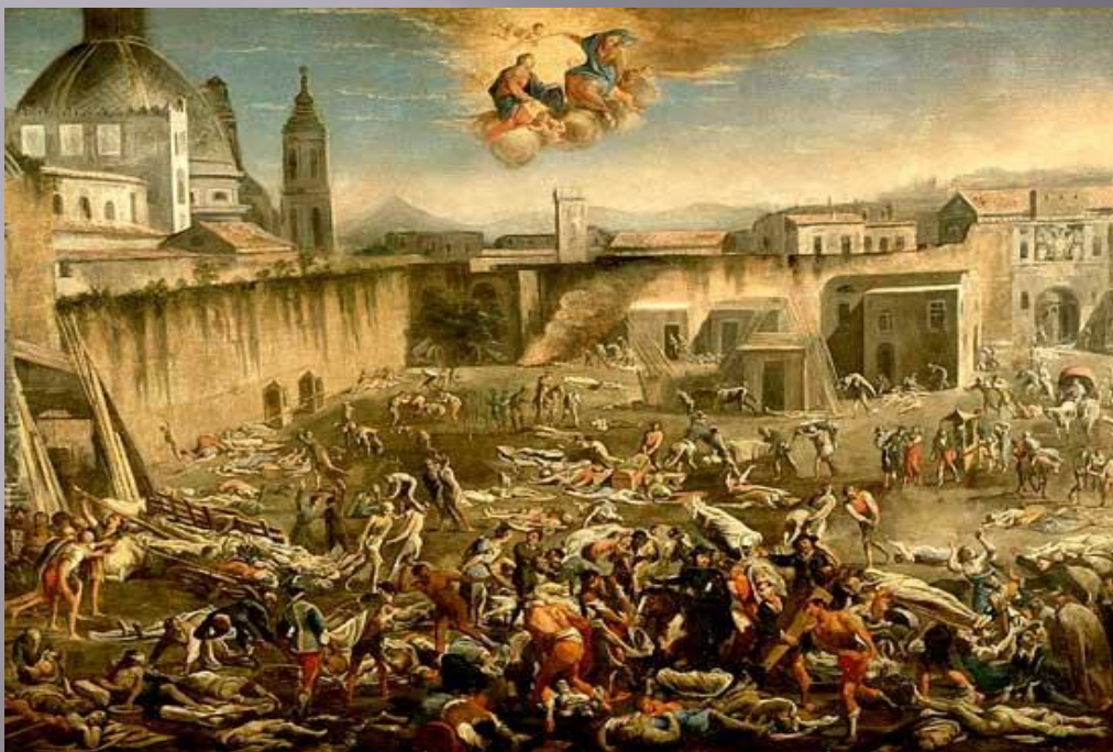
КАРТИНА ЧУМА В НЕАПОЛЕ В 1656 показывает опустошительное действие Черной Смерти (Музей Сан-Мартино, Неаполь.)

Эпидемия - это массовое, прогрессирующее во времени и пространстве в пределах определенного региона распространение инфекционной болезни людей, значительно превышающее обычно регистрируемый на данной территории уровень заболеваемости.