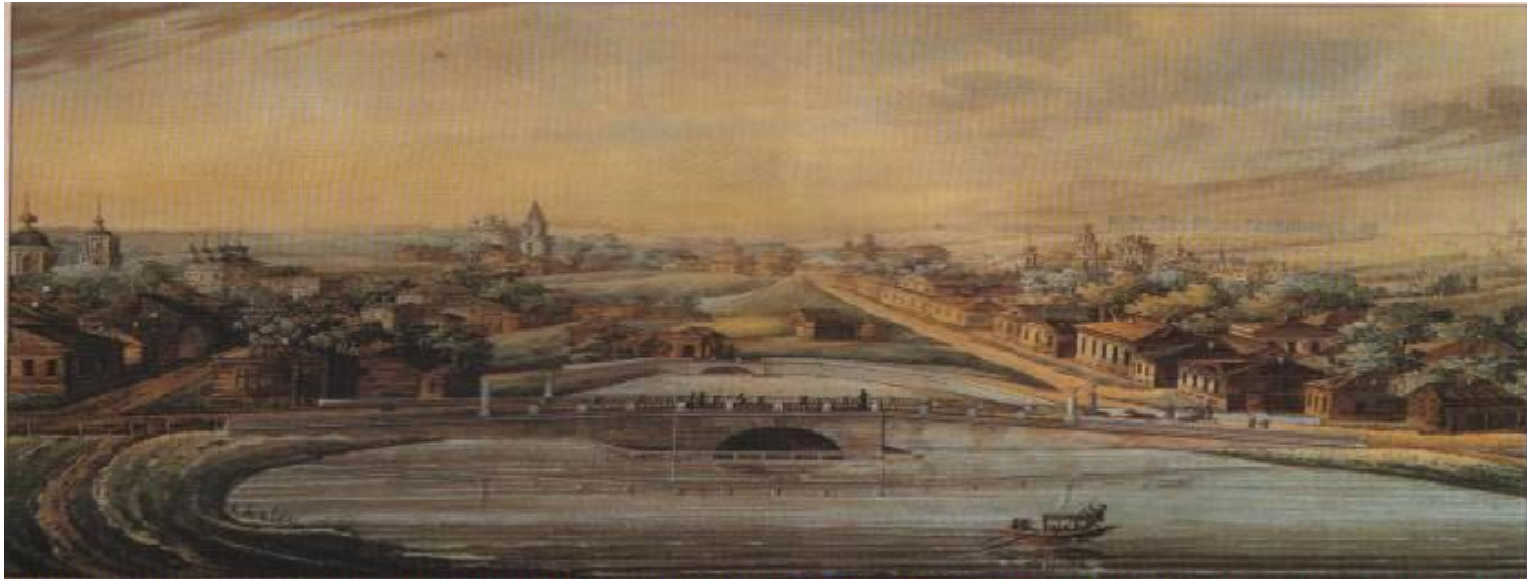
Неизвестный художник. Москва. Прасненские пруды. 1600-е гг.