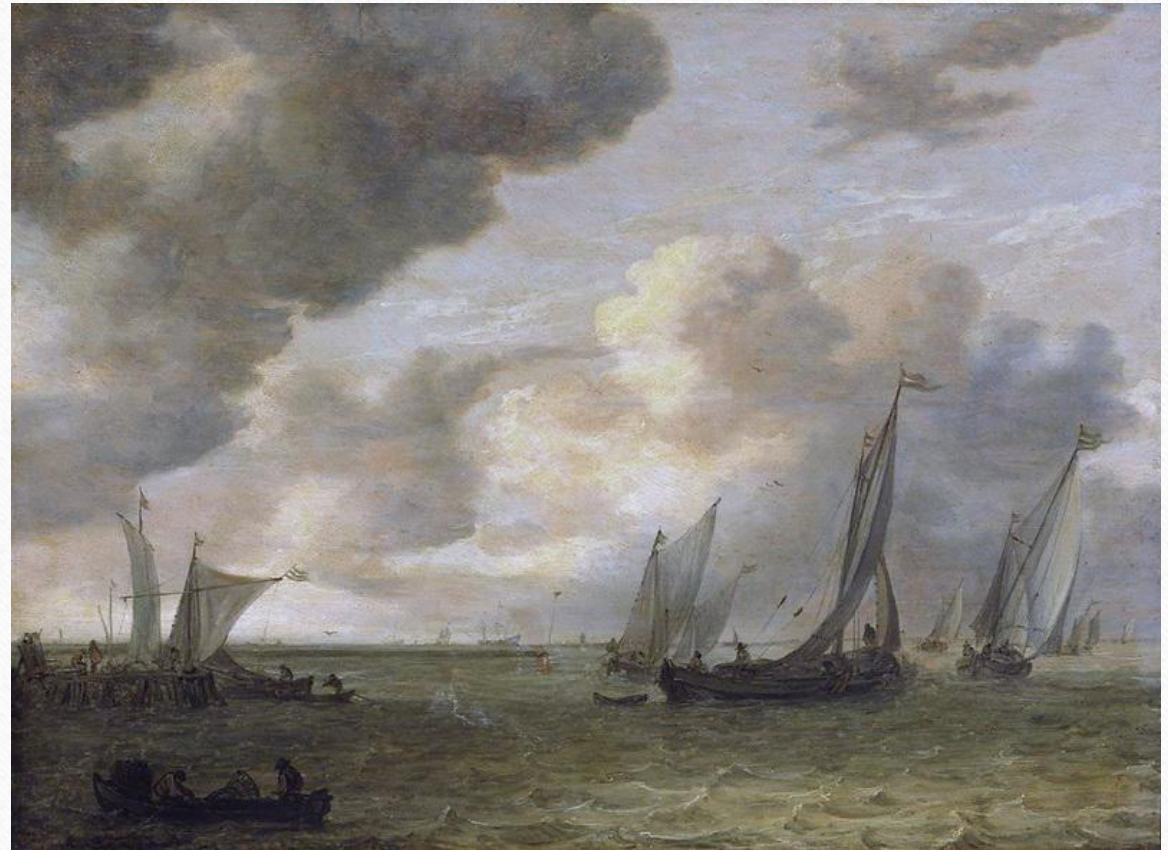
Ян ван Гойен «Вид на Мерведе под Дордрехтом (ок. 1645). Рейксмузей (Амстердам)

Картины Гойена преимущественно монотонны. Художник любил простоту колорита, но при этом его краски гармоничны. Краски он накладывал легким слоем.