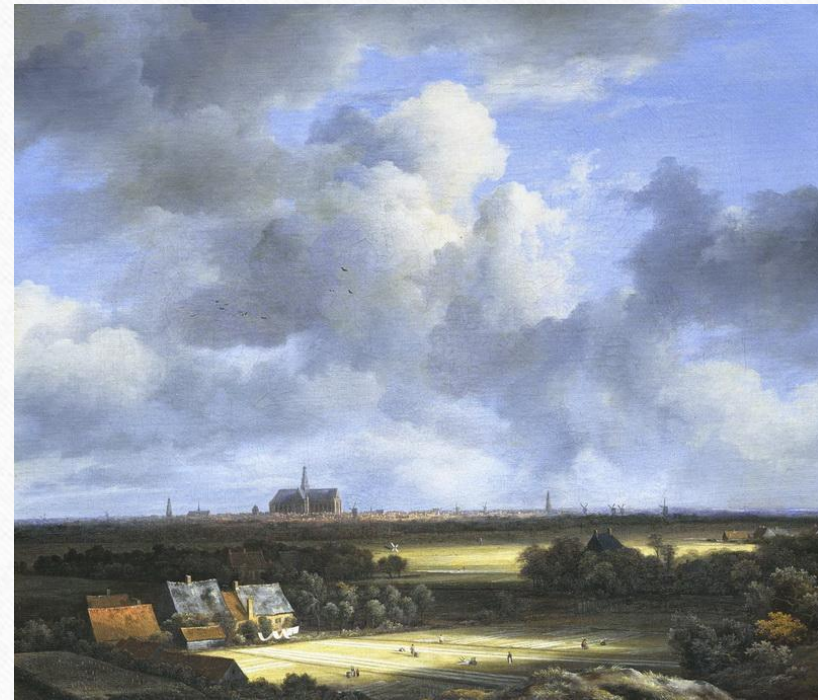
Якоб ван Рейсдал «Вид Харлема с полями» (1670-1680). Маурицхейс (Гаага)