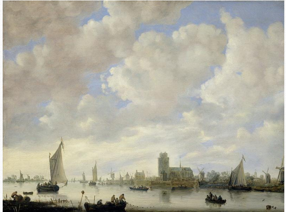
Ян ван Гойен «Вид на реку» (1655). Маурицхейс (Гаага)

Сначала Гойен писал голландские деревни или окрестности с их растительностью, потом в его картинах стали преобладать прибрежные виды, где большую часть картин занимали небо и вода.