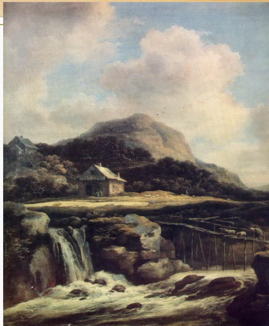
Якоб ван Рейсдал «Горный поток». Музей Метрополитен

Большинство его пейзажей посвящены природе родных Нидерландов, но он писал и дубовые леса Германии, и водопады Норвегии.