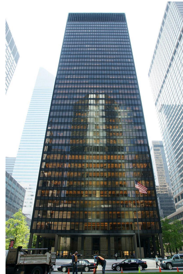
Сигрэм Билдинг, 1956