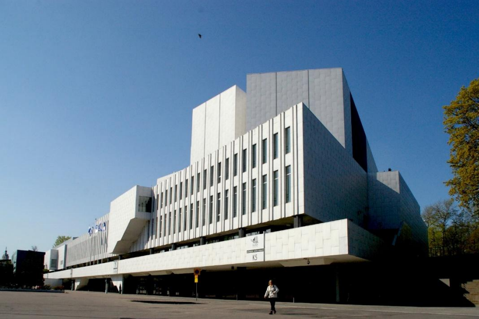
Концертный зал «Финляндия» в Хельсинки, 1971