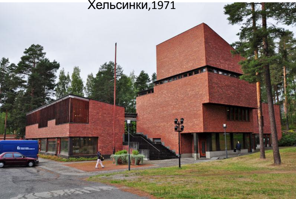
AYUNTAMIENTO DE SĂYNĂTSALO