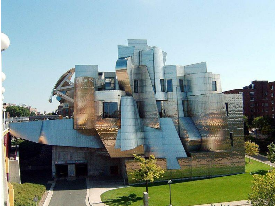
Художественный музей Вейсмана

Гери один из крупнейших архитекторов современности, стоявший у истоков архитектурного деконструктивизма.