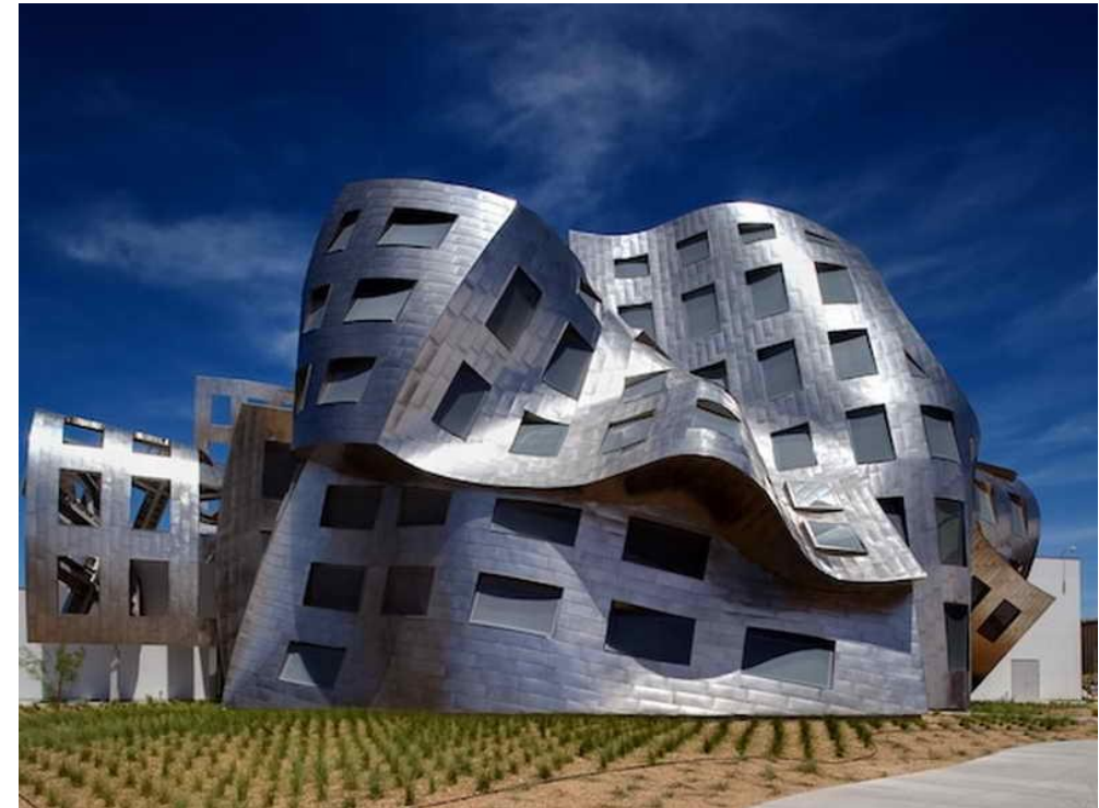
Modern Frank Gehry Inspiration