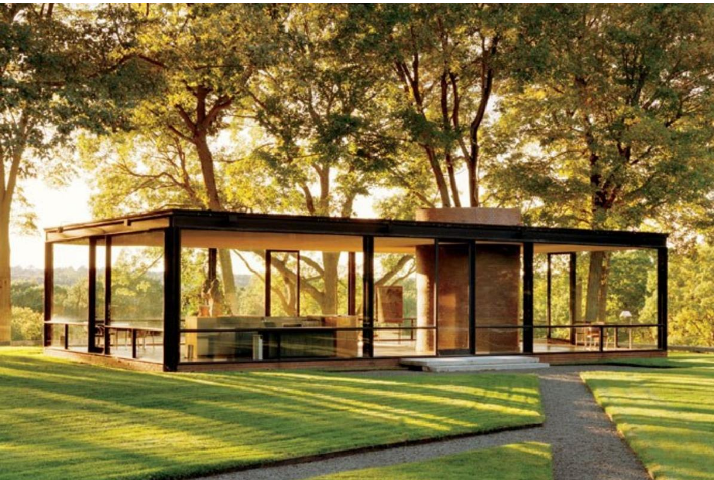
Стеклянный дом (Нью-Канаан), 1949

представитель «интернационального стиля» в американской архитектуре середины XX века, постмодернист.