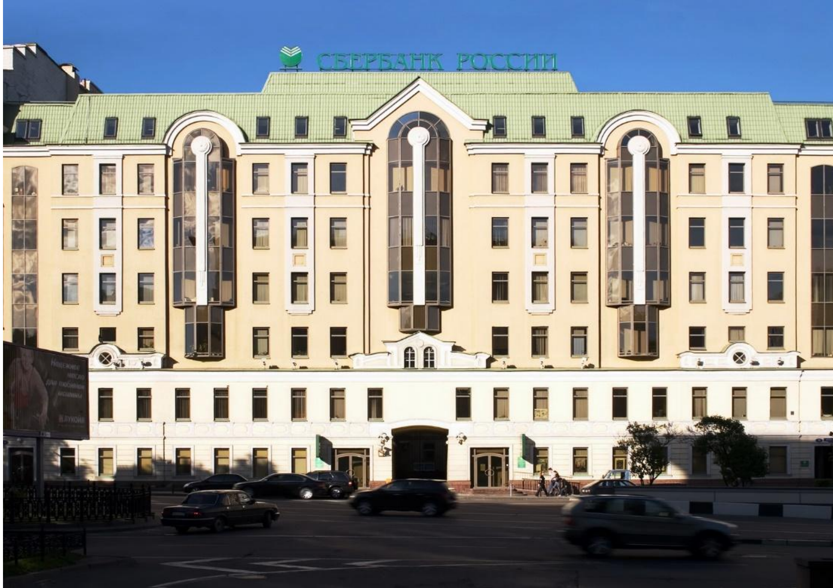
Административное здание Сбербанка России, Москва. На здание «приклеили» стеклянные вытянутые формы и украсили их белой скульптурой, дабы войти в стиль здания.