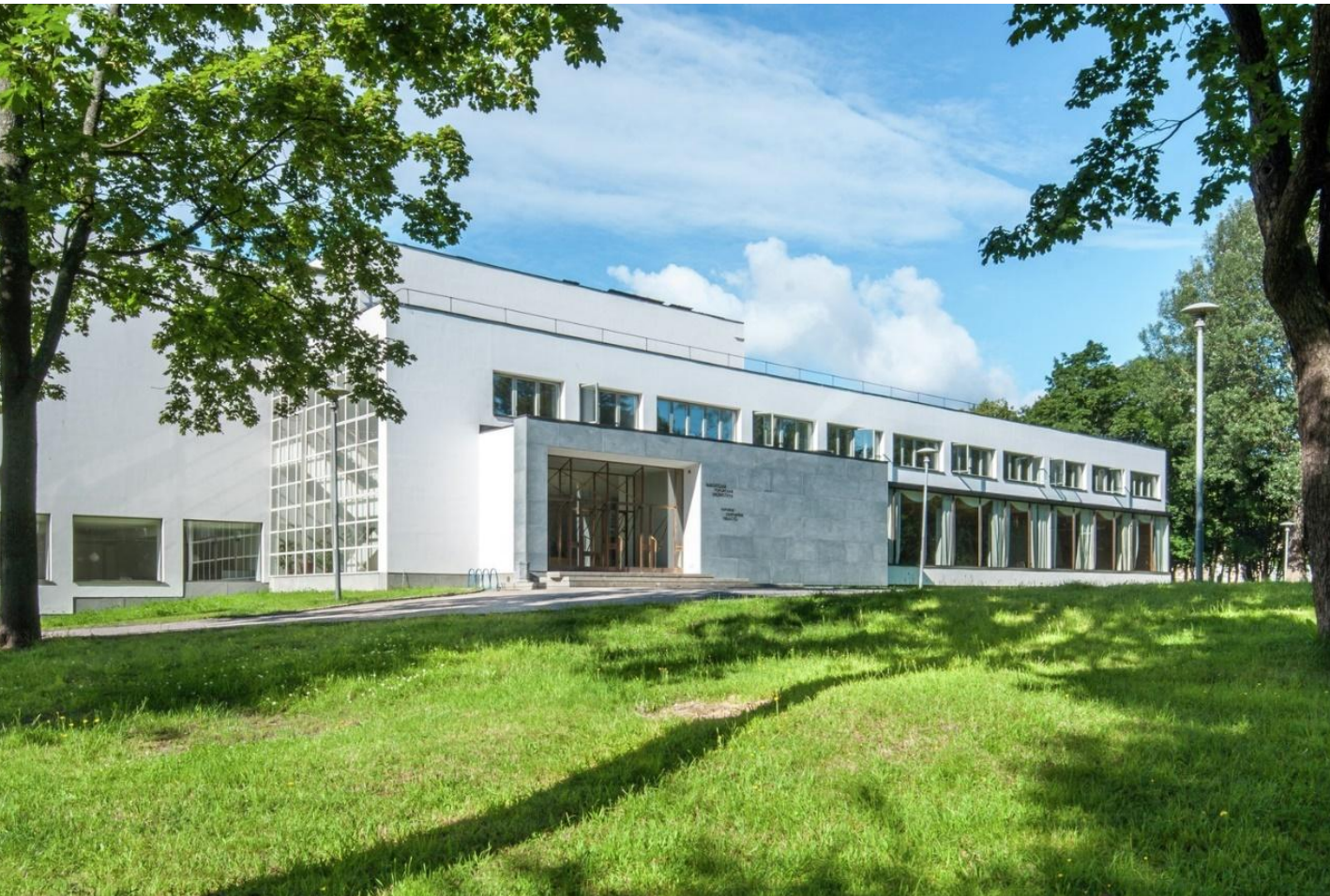
Библиотека в Выборге, 1933-1935

финский архитектор и дизайнер, «отец модернизма» в Северной Европе, один из основоположников современной школы дизайна.