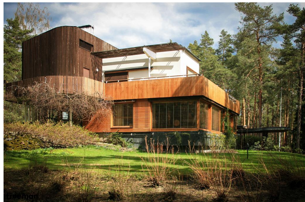
Villa Mairea, Noormarkku, Finland (1937 – 1939)