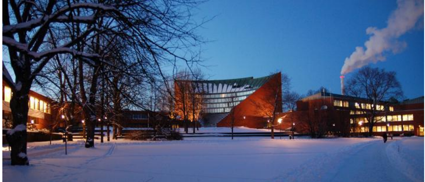
Технологический университет в Хельсинки