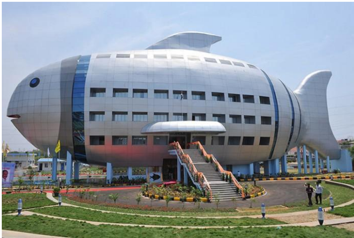
Здание Национального совета развития рыболовства в Хайдарабаде, Индия.

В изначальном проекте форма здания была более стройной, но во время строительства расплнела? и превратилось во что-то невразумительное.