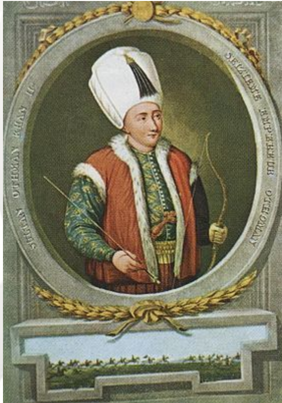
Осман II (1618-1622)