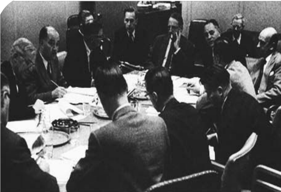
Organizing the first peacekeeping force, the UN Emergency Force; November, 1956

დიდმა ბრიტანეთმა და საფრანგეთმა გადაწყვიტეს კონფლიქტში ისრაელის ჩართვა. ისრაელს კონფლიქტში ჩართვის თავისი მიზეზები ჰქონდა. მას სურდა დაზას სექტორის და სინაის ნახევარკუნძულის დაკავება, გირანის სრუტის ბლოკადის დამთავრება და სუეცის არხში ებრაული გემების მიმოსვლის აღდგენა, რომელიც ეგვიპტემ აკრძალა