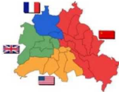
After WWII, Berlin was divided into four Allied occupation zones. The Soviet Zone (in red) later became East Berlin.