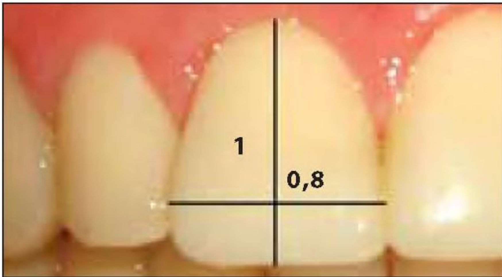
Соотношение ширины и длины центральных резцов верхней челюсти