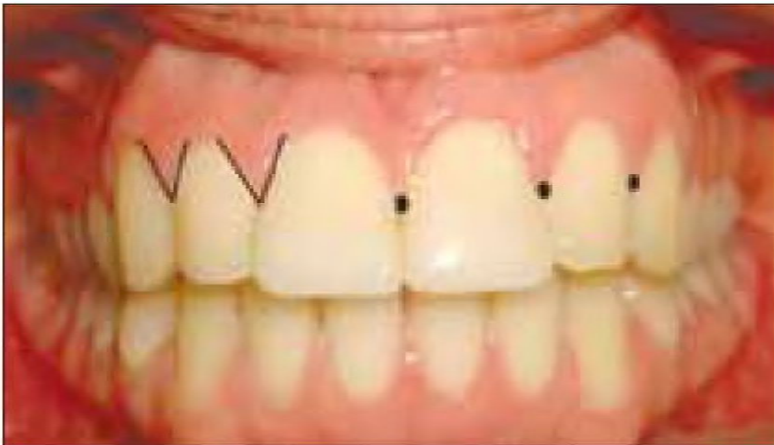
Вершины десневых сосочков во фронтальном участке треугольной формы