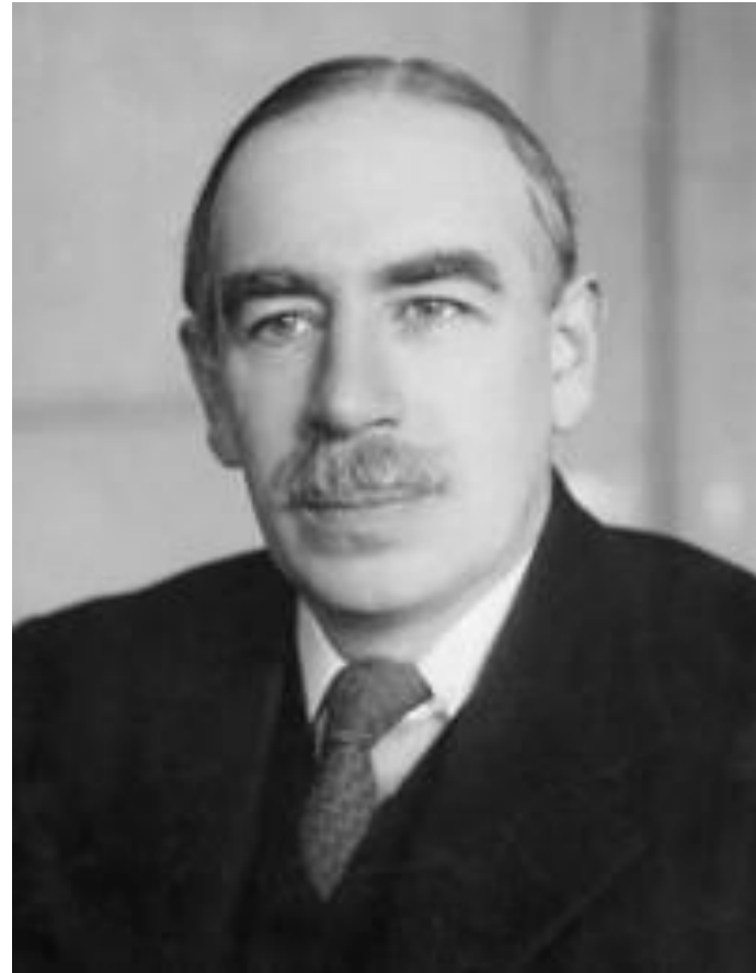
Джон Мейнард Кейнс 1883 - 1946 Экономист