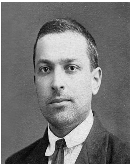
Л. С. Выготский