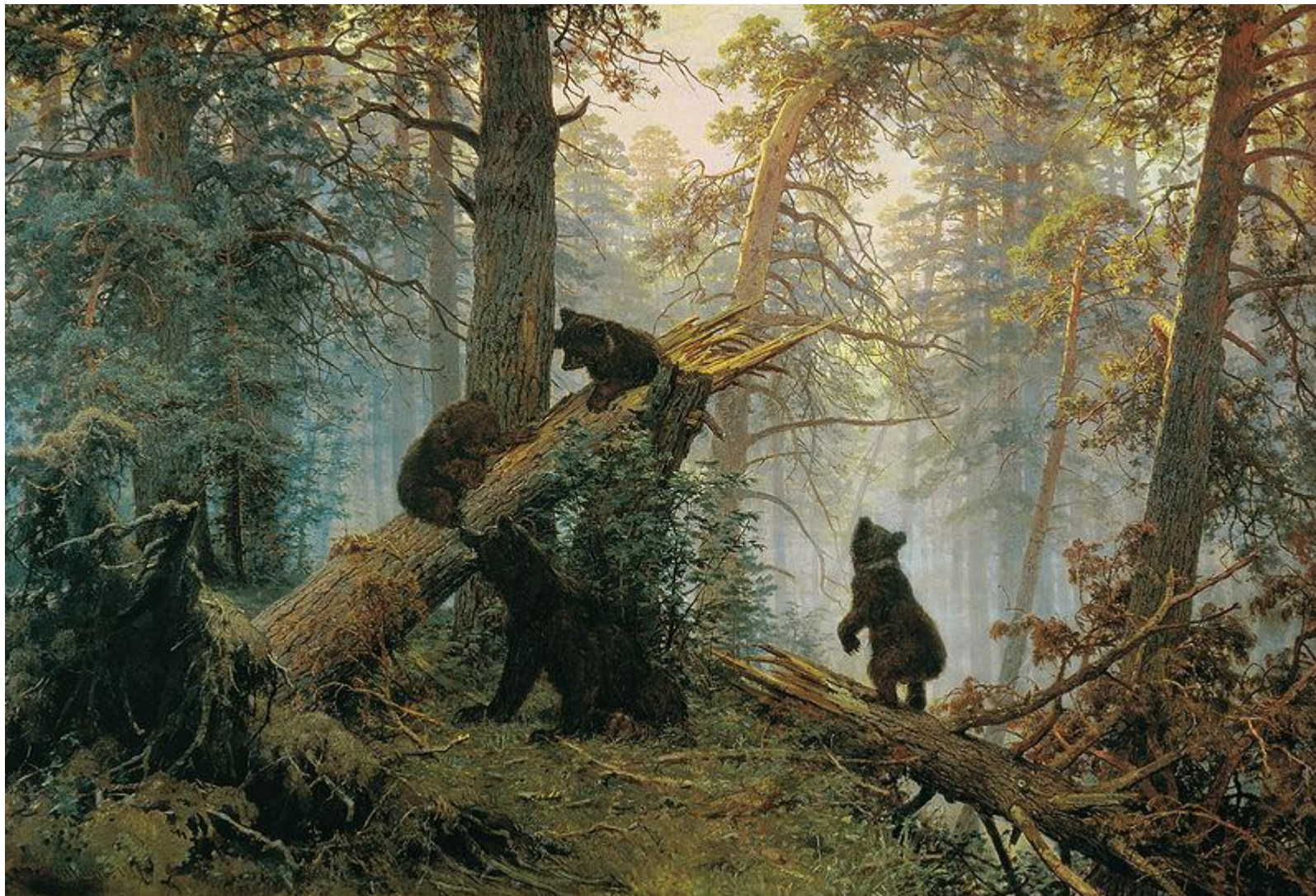
Утро в сосновом лесу. И.В. Шишкин