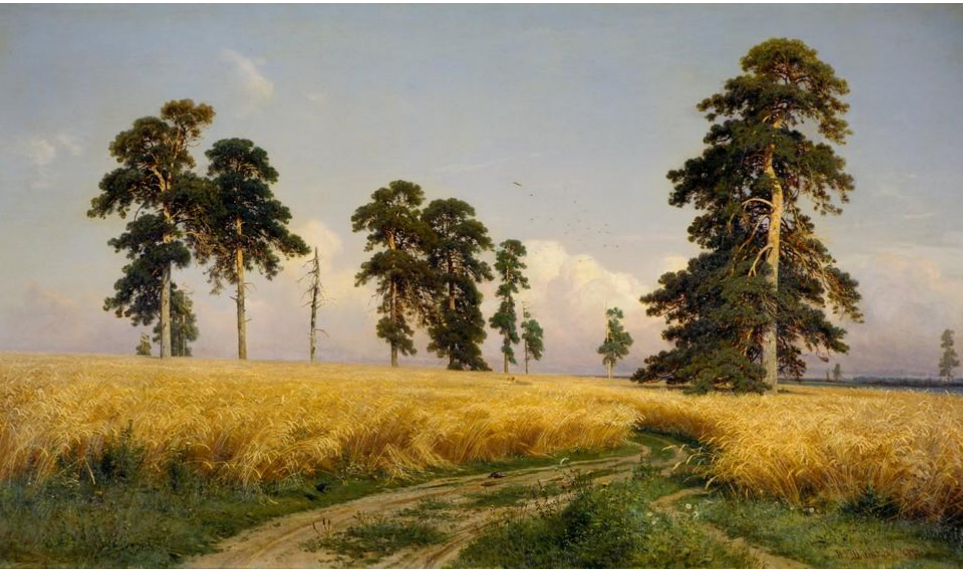
Рожь. И.И. Шишкин