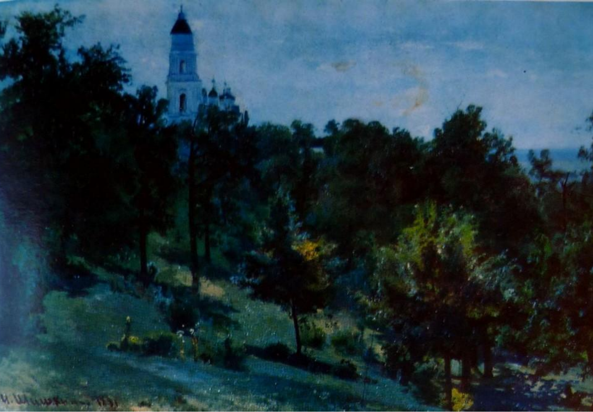
На острове Валааме