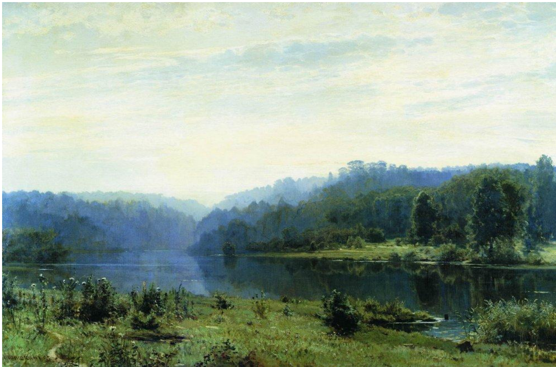
Туманное утро. И.И. Шишкин