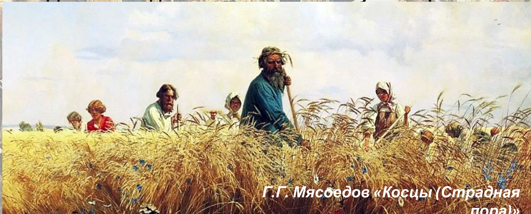
Г.Г. Мясоедов «Косцы (Страдная пора)»

В избе жила крестьянская семья, состоящая из 6—8 человек. В крестьянском хозяйстве трудились и мужчины и женщины. Женились рано — до 20 лет (в одиночку невозможно было вести хозяйство). Средний срок жизни крестьянина составлял 30—40 лет. Доживший до 45—50 лет считался уже стариком..