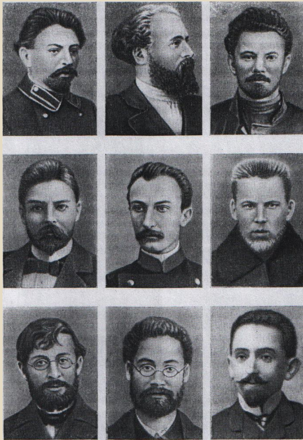
Делегаты I съезда РСДРП

Цели РСДРП— низвержение самодержавия, замена его демократической республикой, введение 8-часового рабочего дня, ликвидация остатков крепостничества. В программе РСДРП было провозглашено право нации на самоопределение.