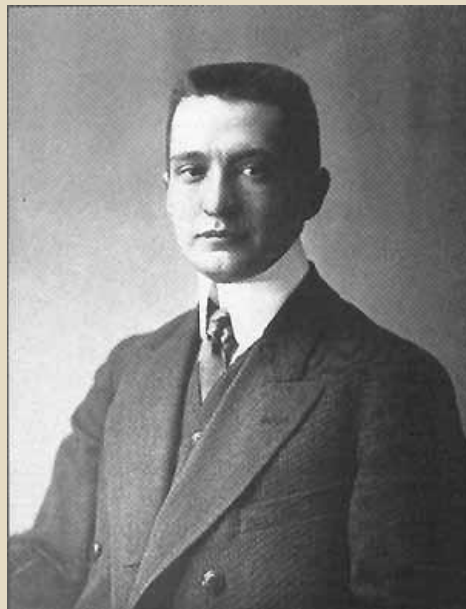
Керенский А. Ф.

24 сентября 1917 г. Керенский сформировал третье коалиционное правительство. Большинство институтов находилось на грани распада. В этой обстановке большевики, выступая с понятными для широких масс лозунгами, укрепили свое влияние и взяли курс на вооруженный захват власти.