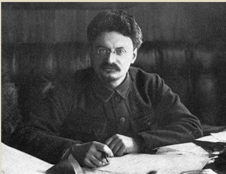
Троцкий Л. Д.

31 августа 1917 г. началась большевизация Советов. Большевистскую программу приняли Московский и Петроградский советы. Председателем исполкома Петросовета стал Троцкий, а исполкома Моссовета – большевик Ногин. Ленин обратился в ЦК партии, Петроградский и Московский комитеты с призывом к вооруженному восстанию. Однако Ленина не поддержали. Все были уверены, что условия не подходящие. Ленин пригрозил выйти из ЦК. 7 октября большевики покинули этот орган. На следующий день по всему Петрограду распространились слухи о готовящемся большевиками вооруженном восстании.