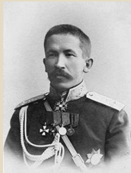
Корнилов Л. Г.