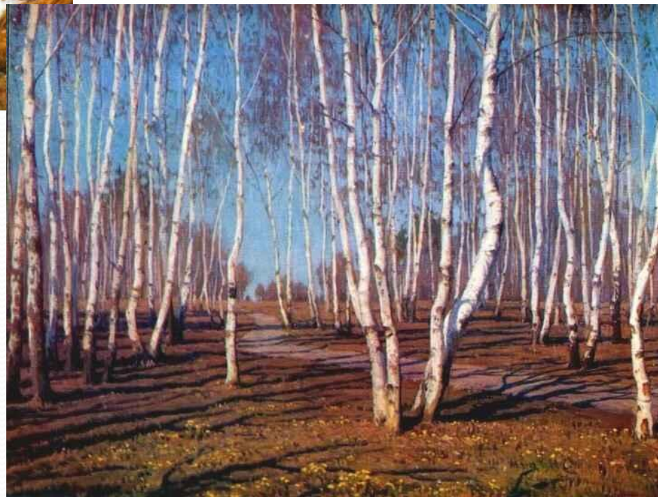
Б. Щербаков. Апрельское солнце.