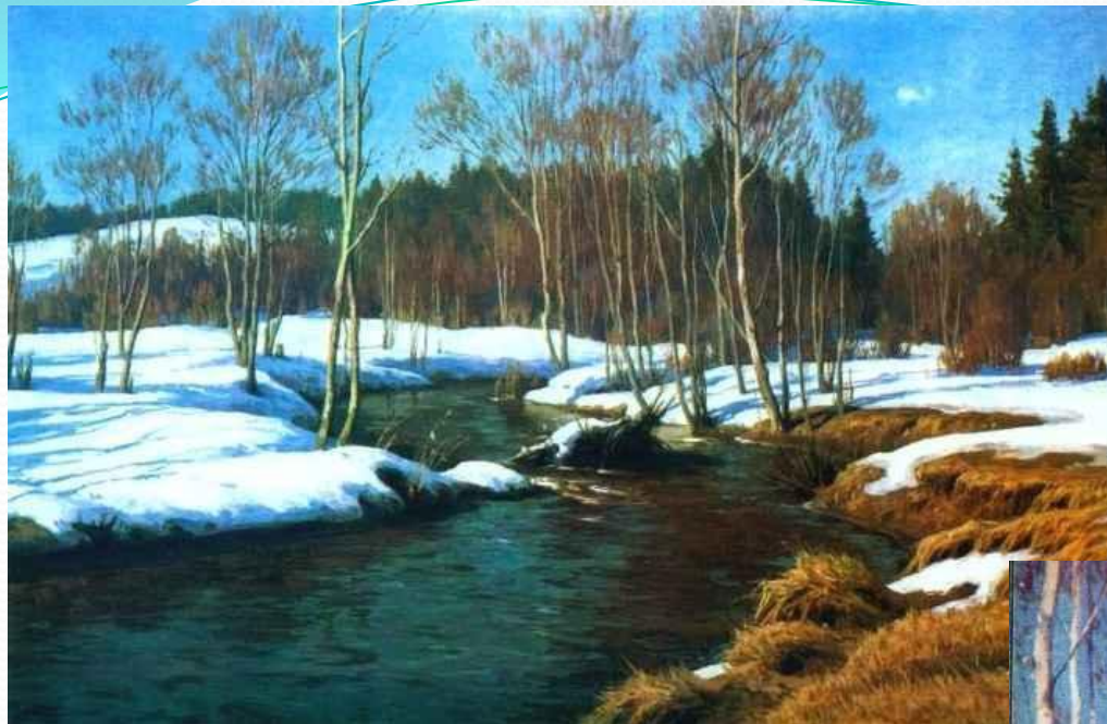
Б. Щербаков. Вода уходит.