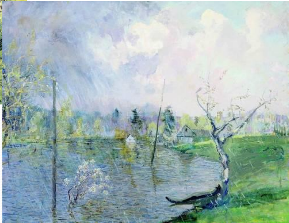
Николай Ромадин. Весенний день.