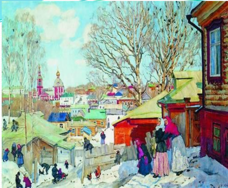
Константин Юон. Весенний день.Сергиев Посад.