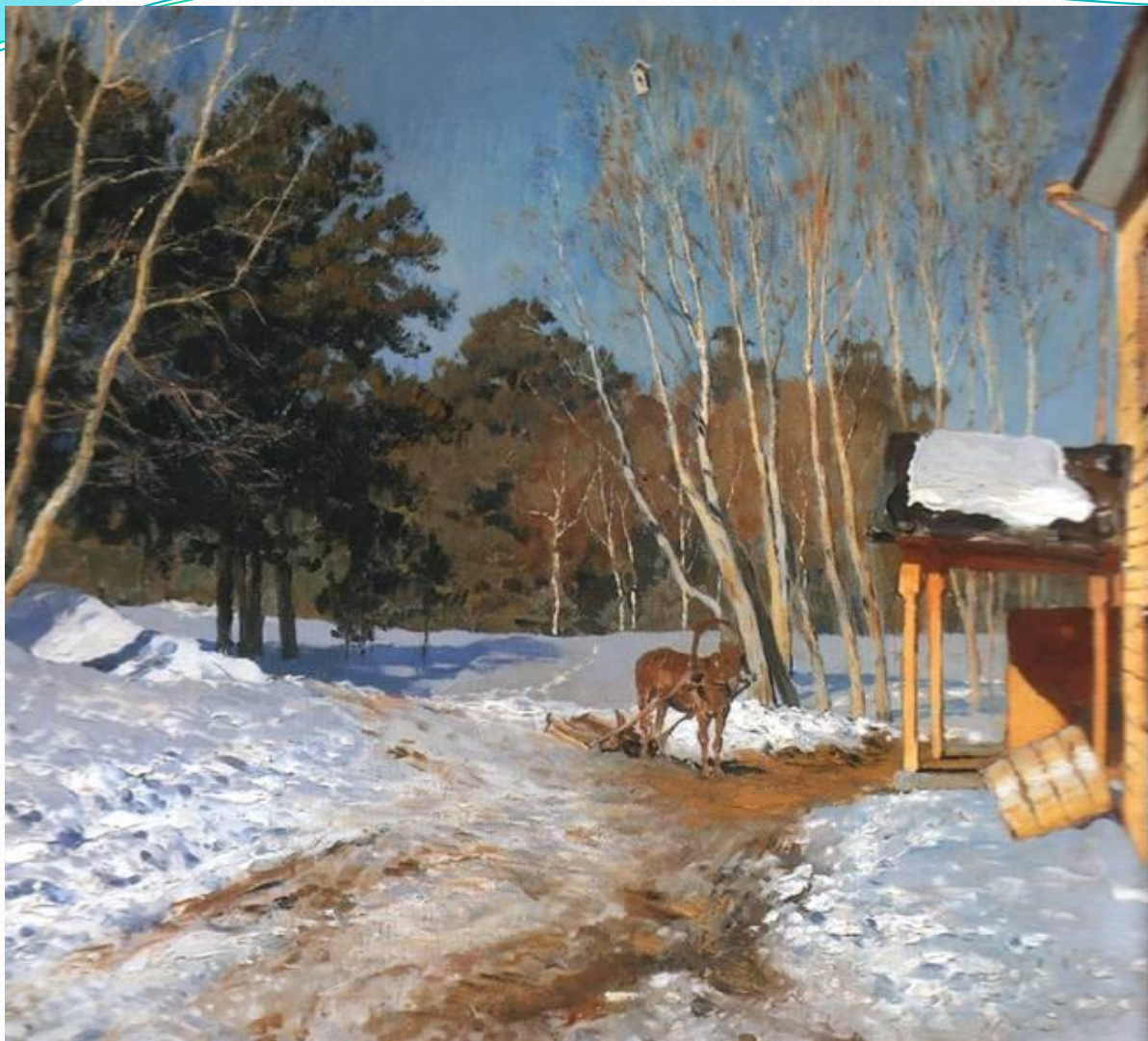
Исаак Левитан. Март.

Весна! Весна по всем приметам, Куда теперь я ни взгляну. Весна с улыбкой и приветом... Затем жить стоит в мире этом, Чтоб видеть русскую Весну!