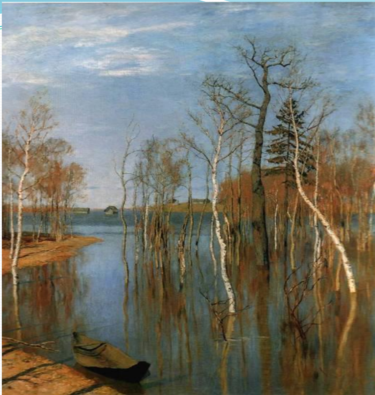
Исаак Левитан. Весна. Большая вода.