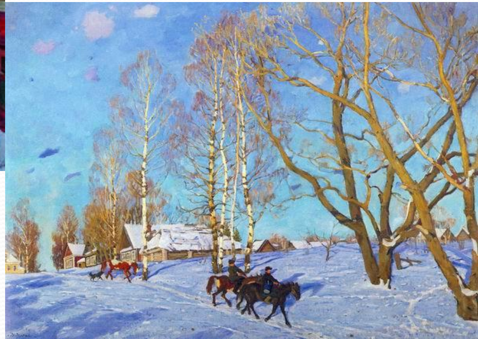
Константин Юон. Мартовское солнце.