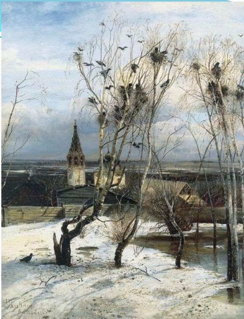
Алексей Саврасов. Грачи прилетели.

"Окраина захолустного городка, старая церковь, покосившийся забор, тающий снег и на первом плане несколько березок, на которых уселись прилетевшие грачи, - и только... Какая простота! Но за этой простотой вы чувствуете мягкую, хорошую душу художника, которому все это дорого и близко его сердцу".