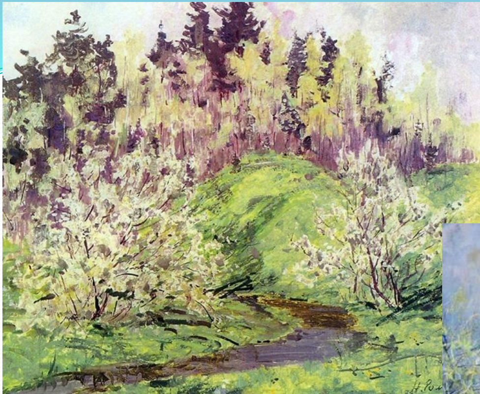
Николай Ромадин. Цветущий бугор.