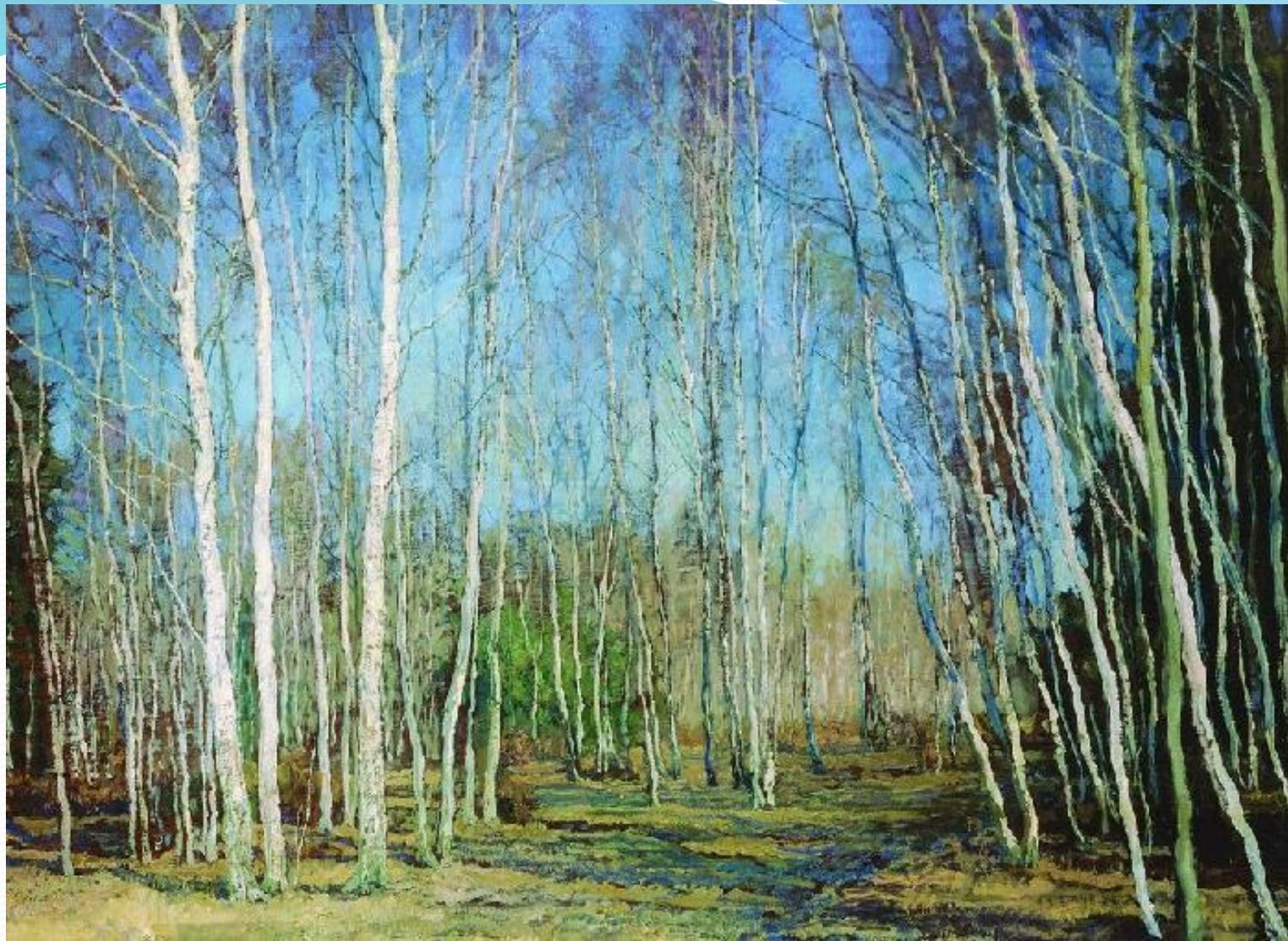
Василий Бакшеев. Голубая весна.