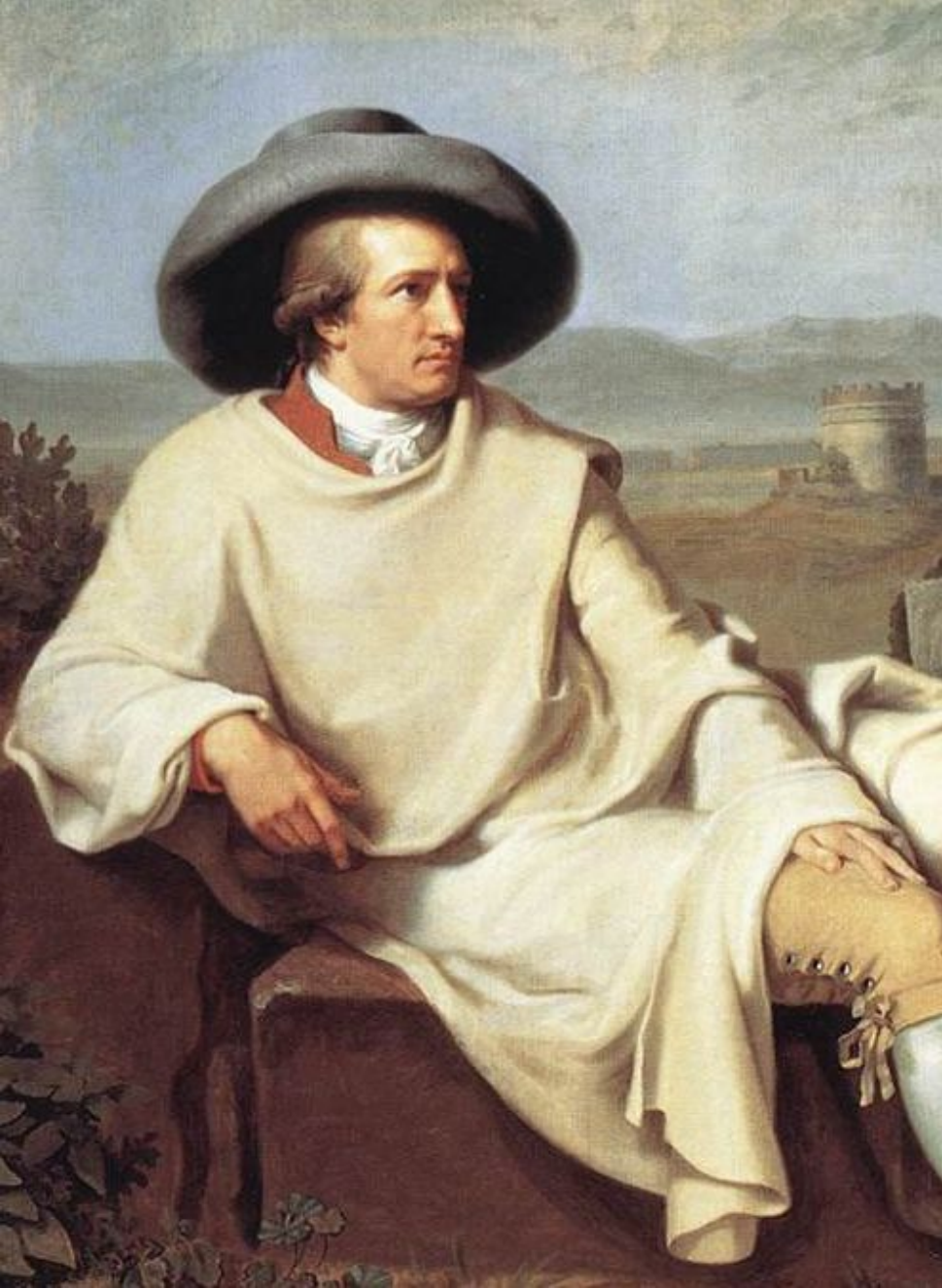
Иоганн Вольфганг фон Гёте