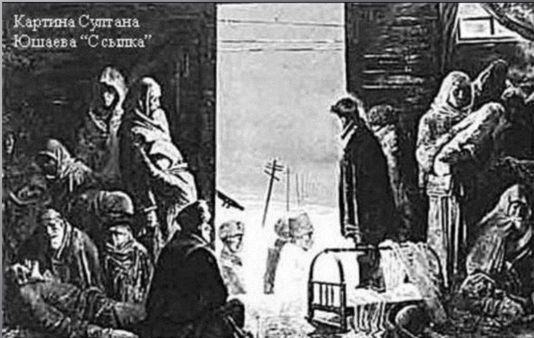
Картина Султана Юшаева "С съшка"