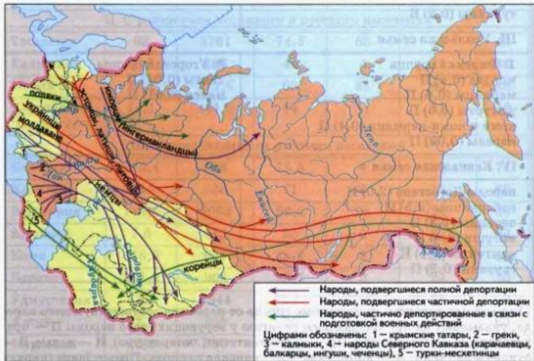
Рис. 10. Депортация народов в СССР