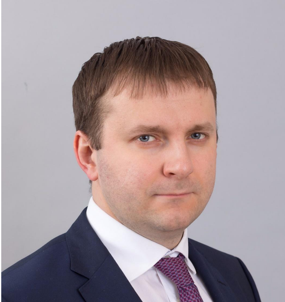
Максим Орешкин, Министр экономического развития Российской Федерации