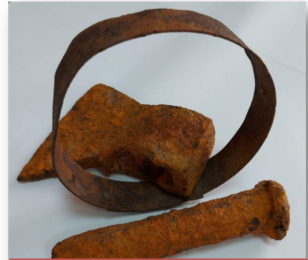
Инструменты, найденные учащимися гимназии №1 в Ядринском районе