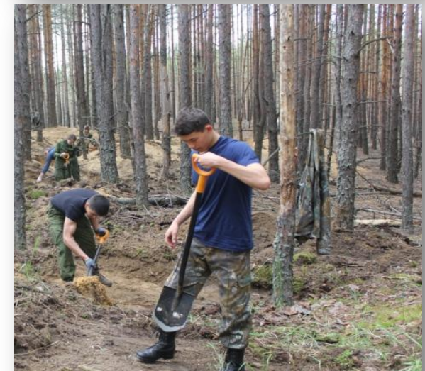
Поисковые отряды на месте строительства Сурского рубежа