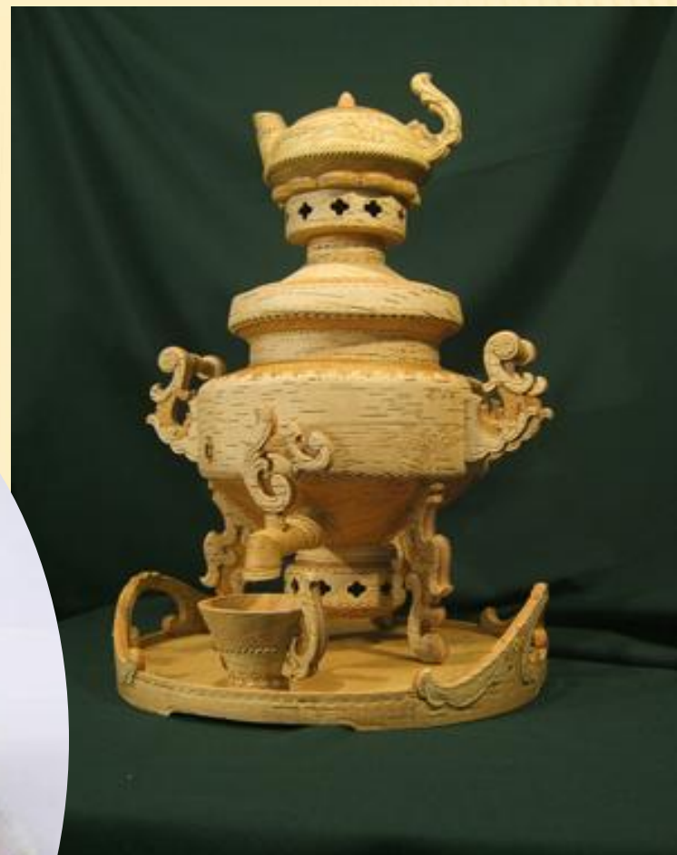
Самовар из бересты