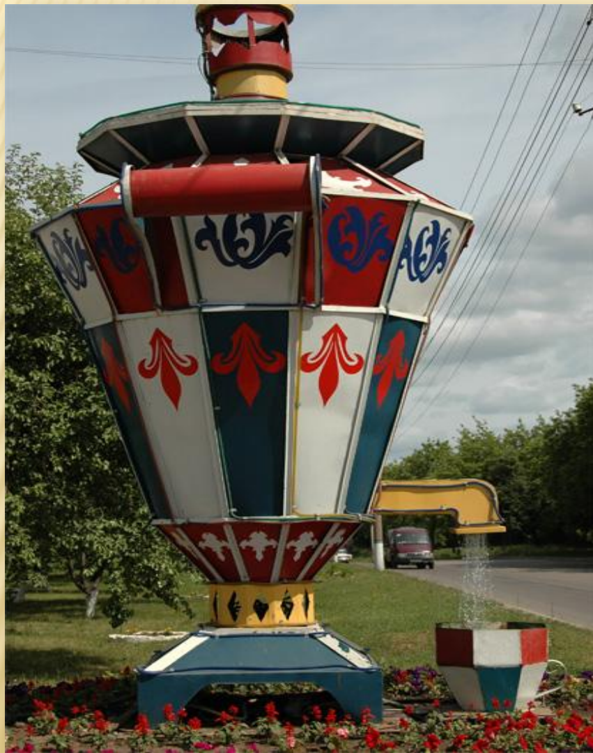
«Самовар-фонтан» в г. Туле