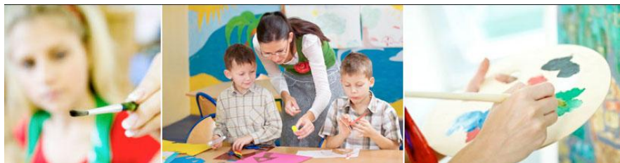
Детская школа искусств (культура)