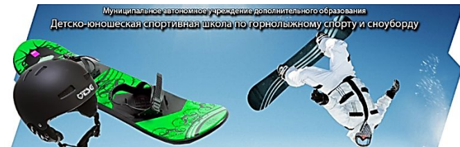
ДЮСШ по горнолыжному спорту и сноуборду (образование)