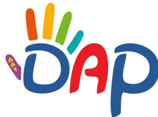
Дом детского творчества «Дар» (образование)