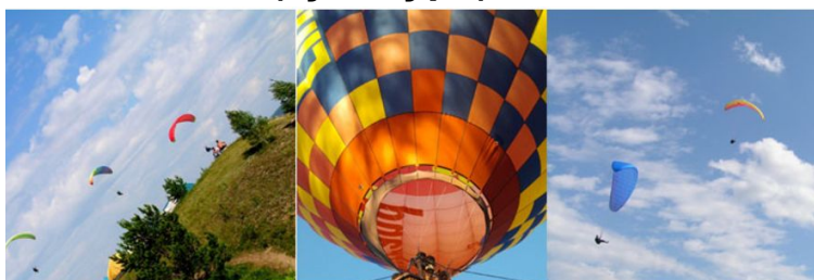
Дом детского и юношеского туризма и экскурсий (образование)