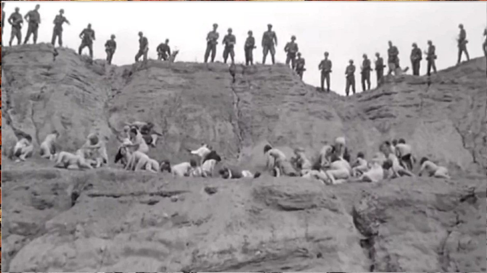
каратели не жалели никого, в том числе и детей.